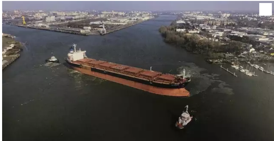
Un bateau en plein évitage dans la rade de Trentemoult

Trois auteurs ont compilé leurs photographies de bateaux à la manœuvre dans la rade de Trentemoult. Leur livre a pour nom « Évitage à Trentemoult-les-Isles », il est couplé d'une exposition visible les 20 et 21 novembre.