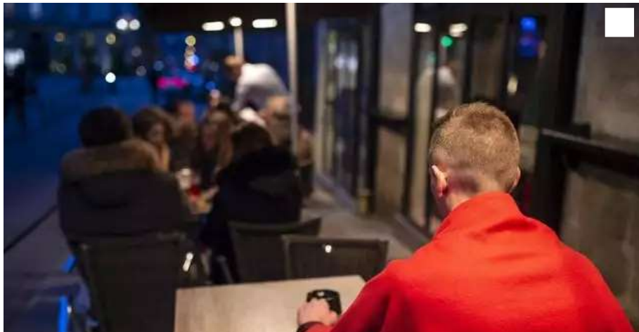
Certaines terrasses proposent déjà des plaids à leurs clients.

Le groupe local EELV-Nantes regrette l'absence de concertation avec la maire (PS) de Nantes sur la question des terrasses chauffées, toujours pas interdites. Et il met en avant des solutions de substitutions.