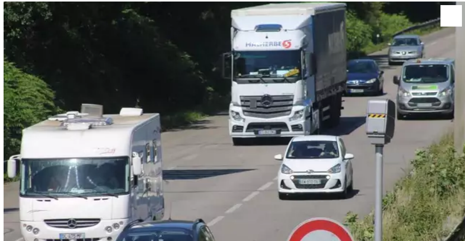
Le radar de Kervignac, sur la RN 165, entre Lorient et Vannes.

Des automobilistes ont signalé sur les réseaux sociaux avoir été flashés à plusieurs reprises par le radar sur la RN 165, à Kervignac (Morbihan). La préfecture assure qu'il n'y a aucun dysfonctionnement.