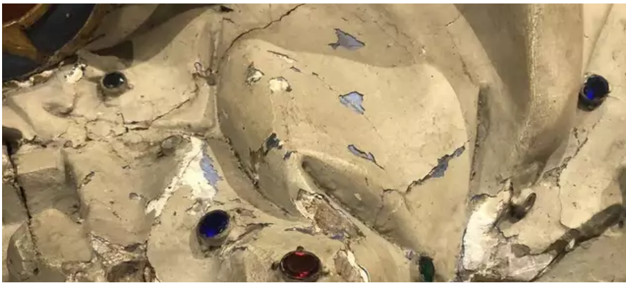
Gros plan sur une partie abîmée, au socle de la statue.