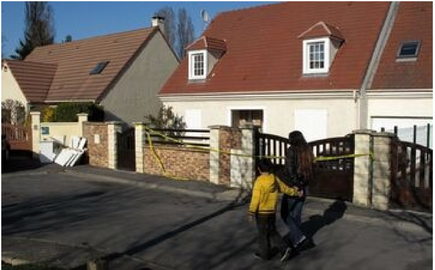
Abonnés 10 ans après la mort suspecte d'Aïchatou à Goussainville, son mari renvoyé devant les assises