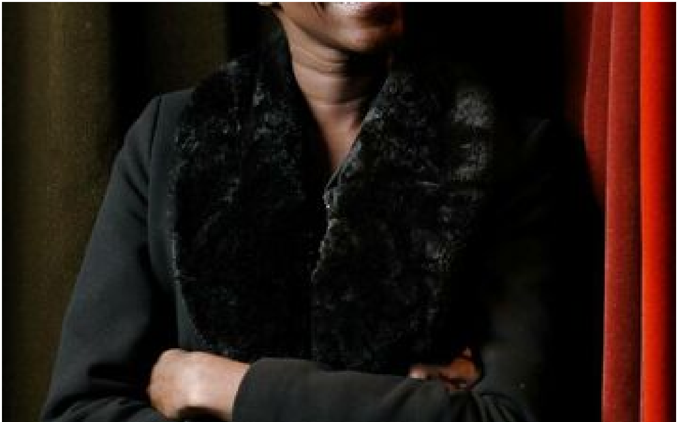
«Zemmour, il te ramène dans ton pays» : visée par des injures racistes, l'actrice Annabelle Lengronne porte plainte