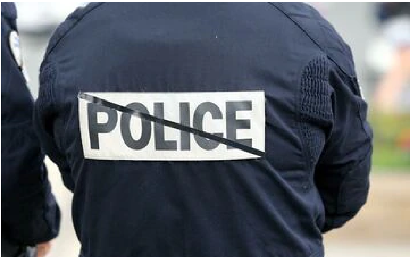
Niort : une femme de 63 ans battue à mort chez elle, son fils soupçonné