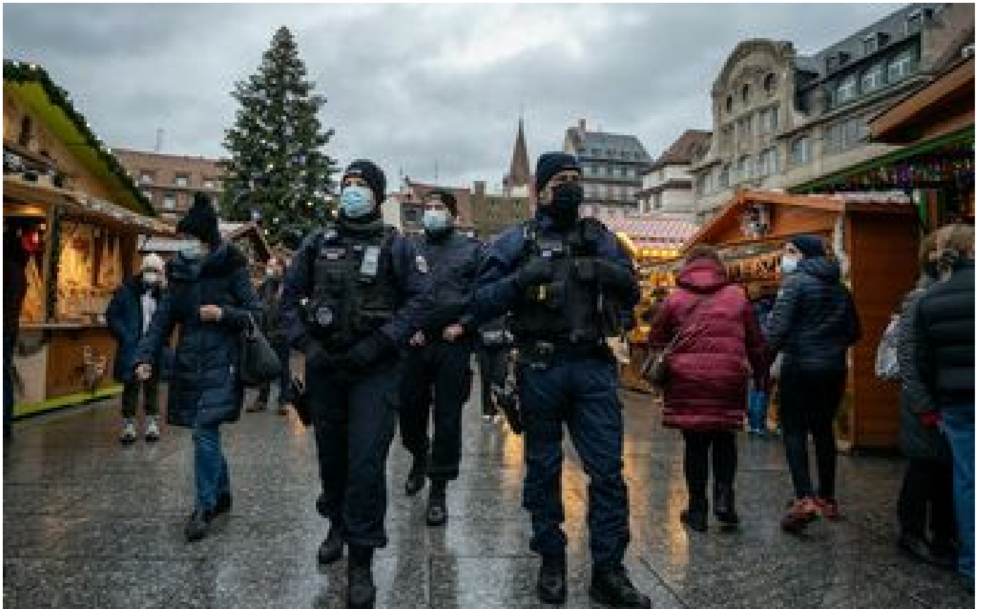
Strasbourg : un dispositif de sécurité «conséquent» pour la nuit de la Saint-Sylvestre