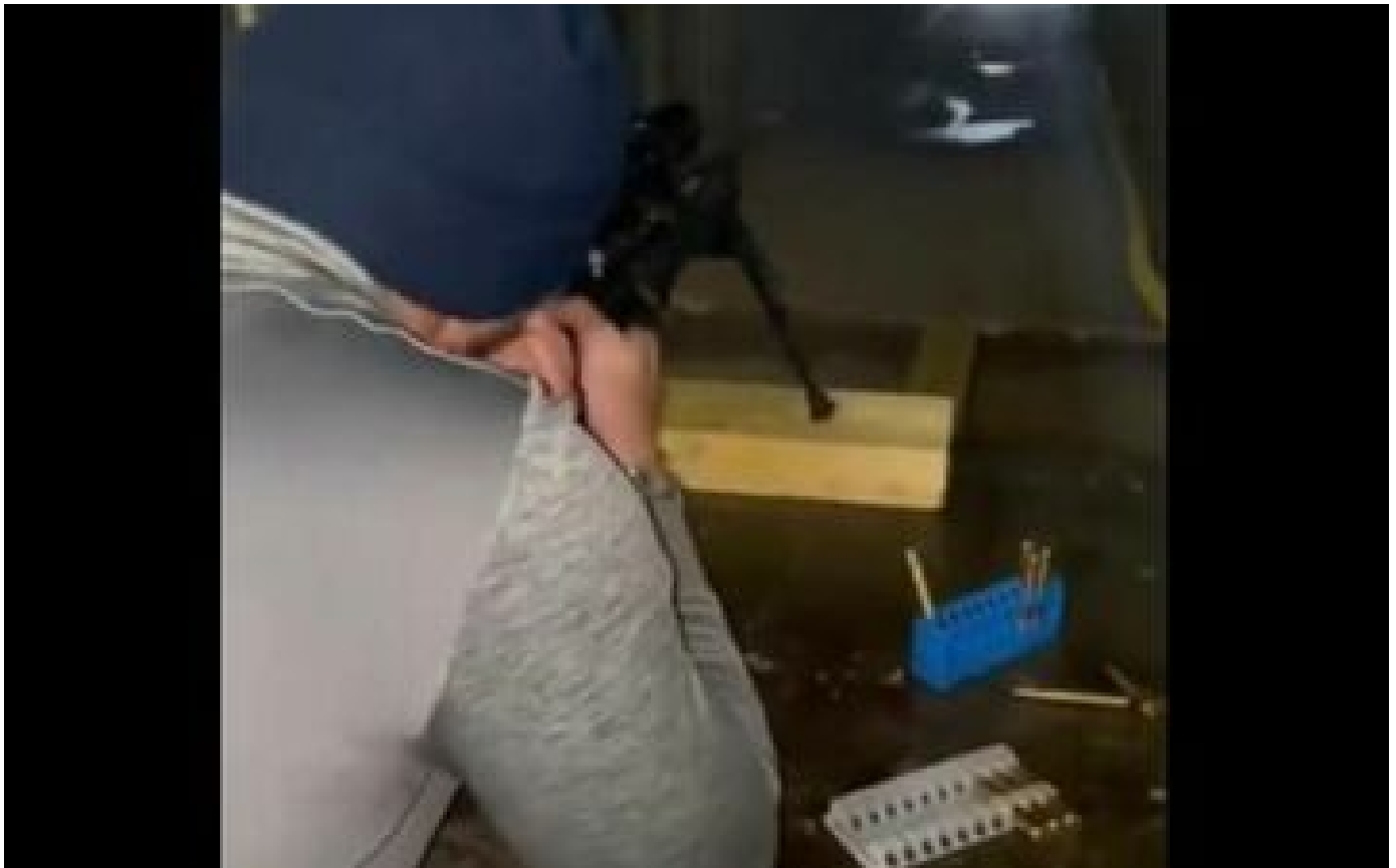
Vidéos simulant des tirs sur Macron et des Insoumis: deux personnes jugées en comparution immédiate