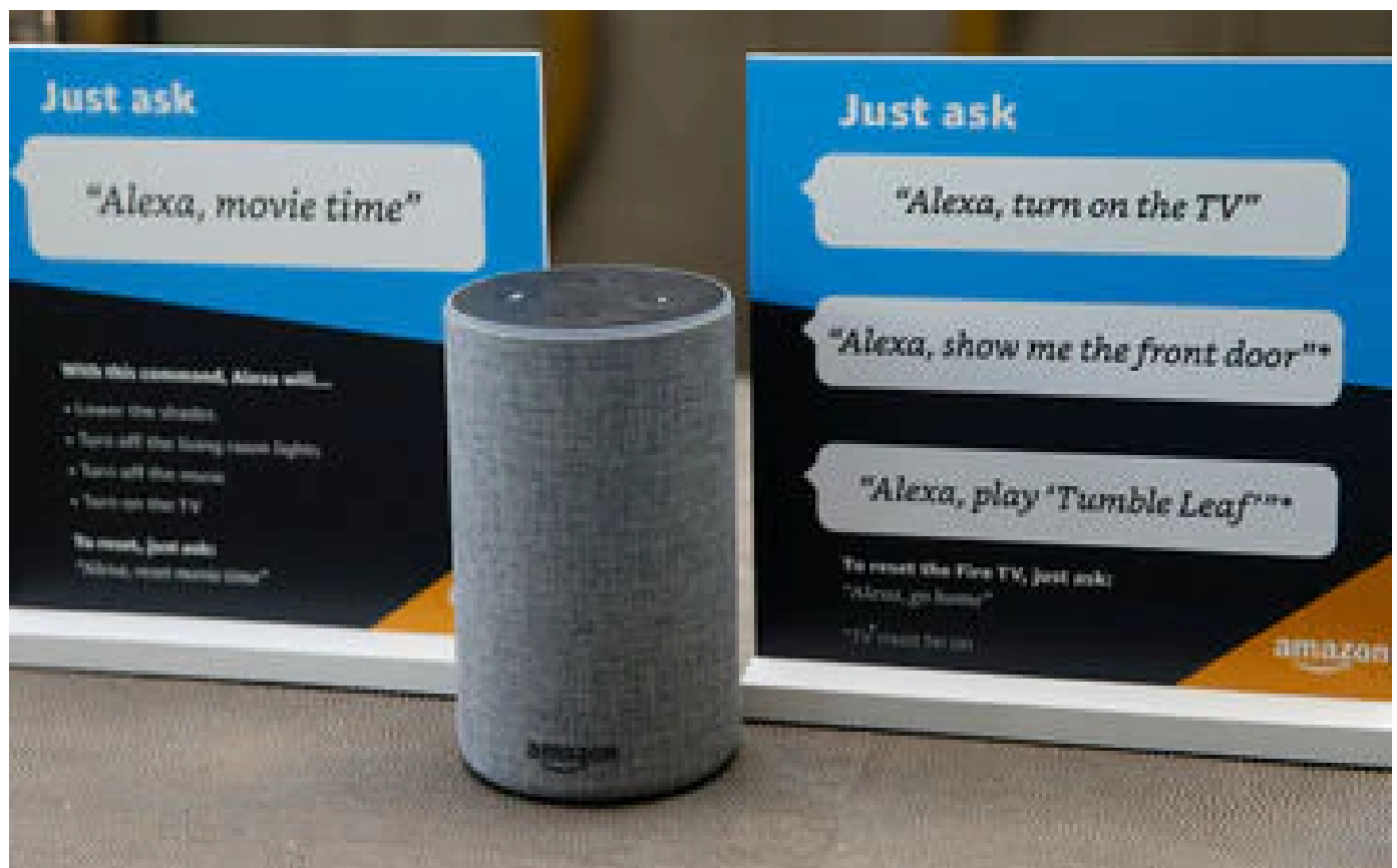
Alexa, l'assistant vocal d'Amazon, a encouragé une enfant de 10 ans à toucher une prise électrique