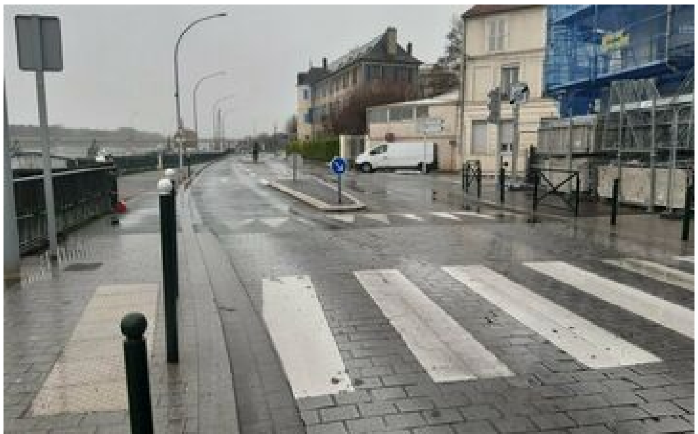
« Une scène très violente » : un fils poignarde mortellement son père en pleine rue à Ablon-sur-Seine