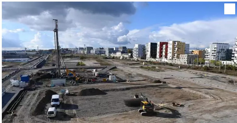
Le site du futur CHU sur l'île de Nantes.

Alors même que les terrassements du futur CHU sont terminés et que la construction proprement dite démarre sur l'île de Nantes, au début de 2022, CHU Actions-santé défend un autre modèle.