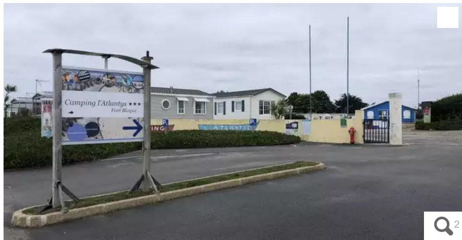
L'actuel camping l'Atlantys à Plœmeur, qui est vendu, est classé 3 étoiles. Il dispose de 189 emplacements.

Mardi 14 décembre 2021, entre autres sujets, les élus de Plœmeur (Morbihan) se prononceront sur la cession du camping l'Atlantys, à Fort Bloqué. Un sujet qui divise.