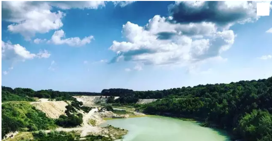
La fin de l'exploitation du site de Kerbrient (Plœmeur) va libérer 50 hectares. De quoi imaginer bien des destinations futures.

Conseil municipal. Mardi 14 décembre 2021, les élus Plœmeurois ont examiné et approuvé le budget primitif 2022. La ville va investir 7,7 millions d'euros. Y figure notamment l'étude sur le devenir de la carrière de Kerbrient, sur le site des Kaolins.