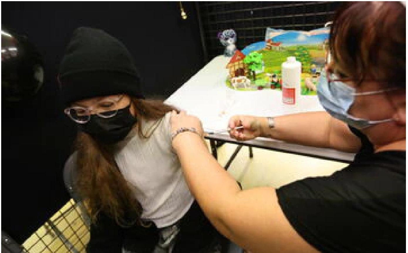
Vaccination anti-Covid des enfants de 5 à 11 ans : feu vert du gouvernement