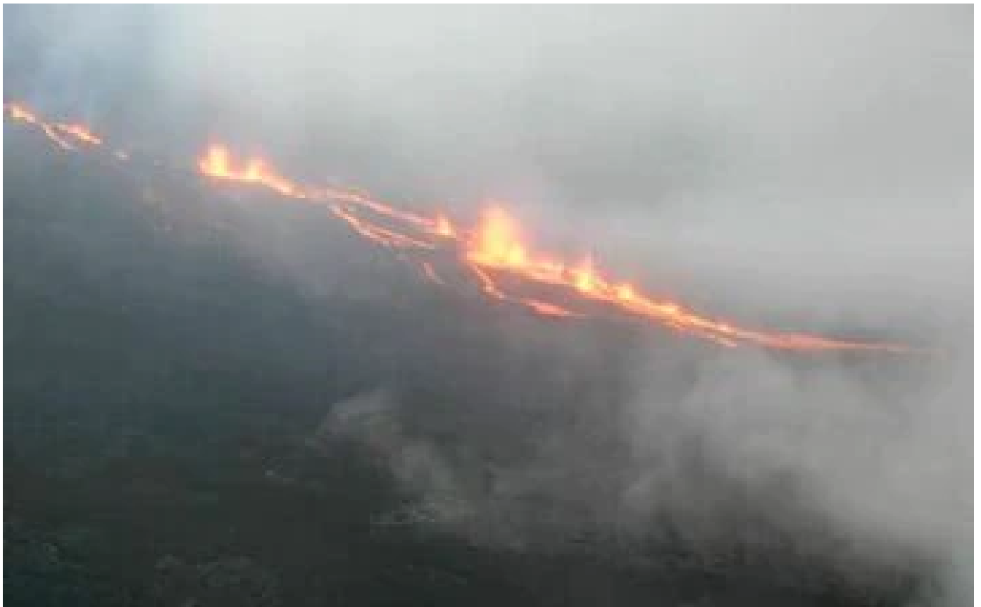
La Réunion : le Piton de la Fournaise entre en éruption pour la seconde fois de l'année