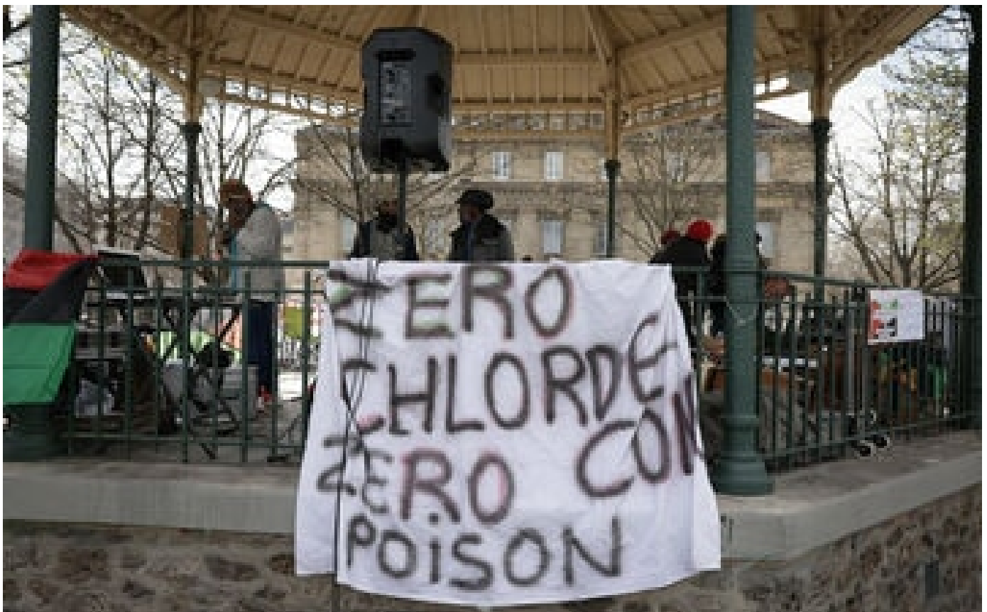
Exposition au chlordécone : les cancers de la prostate officiellement reconnus comme maladie professionnelle