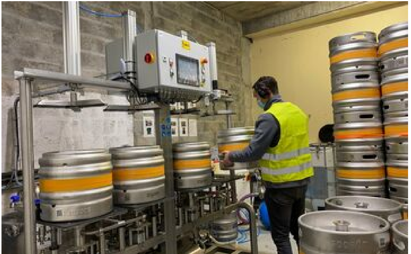
Abonnés Déchets plastiques : Soofût, l'entreprise qui propose une alternative aux fûts jetables des petits brasseurs