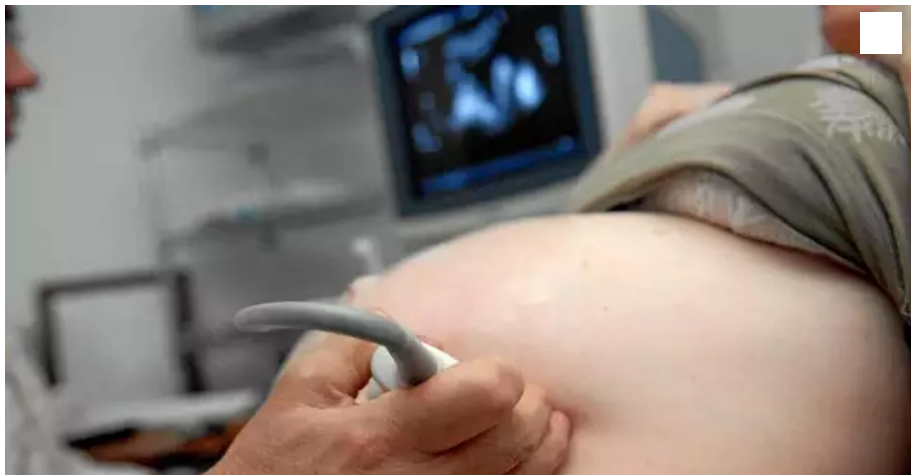
Au CHU, quelques cas graves de Covid chez des femmes enceintes sont en hausse.

Les professionnels de santé au CHU gèrent des situations de femmes enceintes non-vaccinées, gravement touchées par le Covid-19.