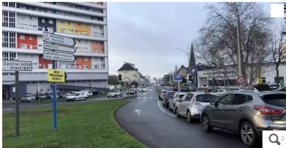
C'est la ruée vers le « drive Covid » à Lorient, en ce dimanche 2 janvier 2022.

Le « drive Covid », où sont pratiqués des tests PCR, est pris d'assaut ce dimanche 2 janvier 2022. Le site est en effet exceptionnellement ouvert jusqu'à midi.