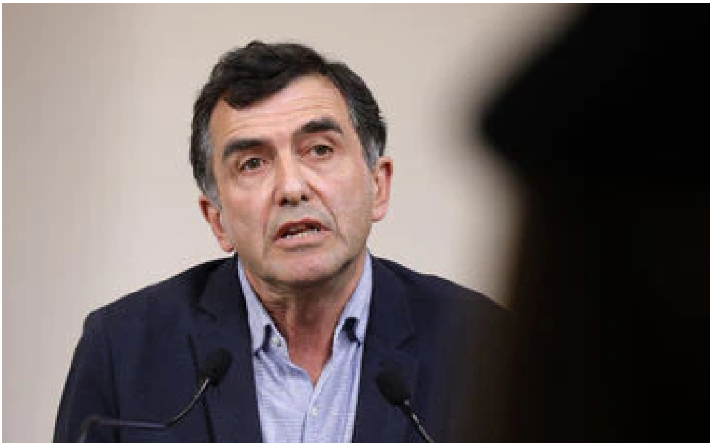
Covid-19 : vers un pic épidémique à la mi-janvier, selon l'épidémiologiste Arnaud Fontanet