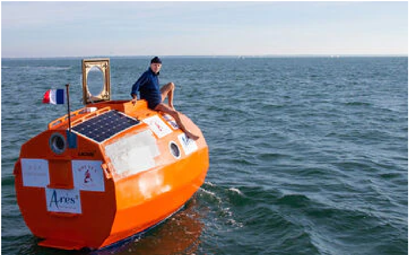
Abonnés Traversée de l'Atlantique : chavirage, solitude, hallucinations... plongée dans une folle odyssee