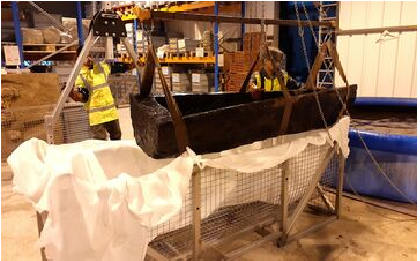
Puy-de-Dôme : des sarcophages datant du IXe siècle conservés dans un lac d'Issoire