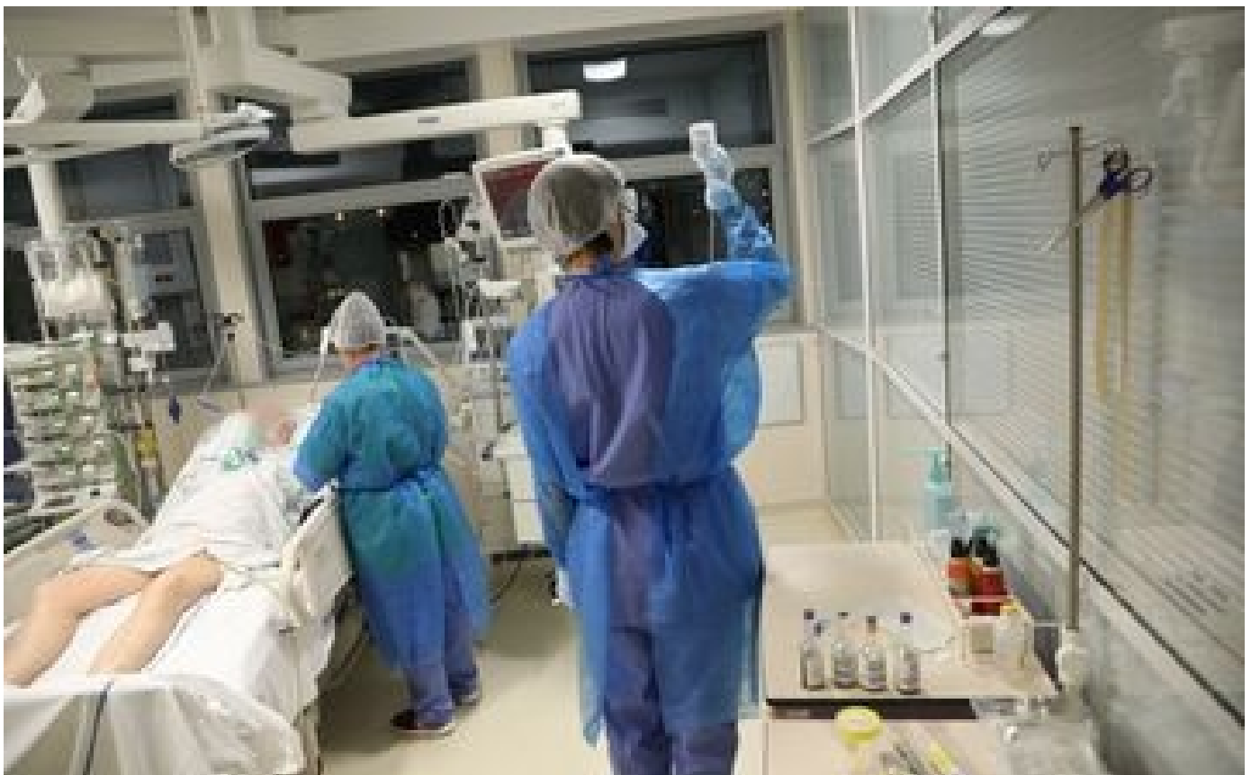
Les non vaccinés devraient pouvoir dire s'ils souhaitent ou non être réanimés, estime le Pr Grimaldi