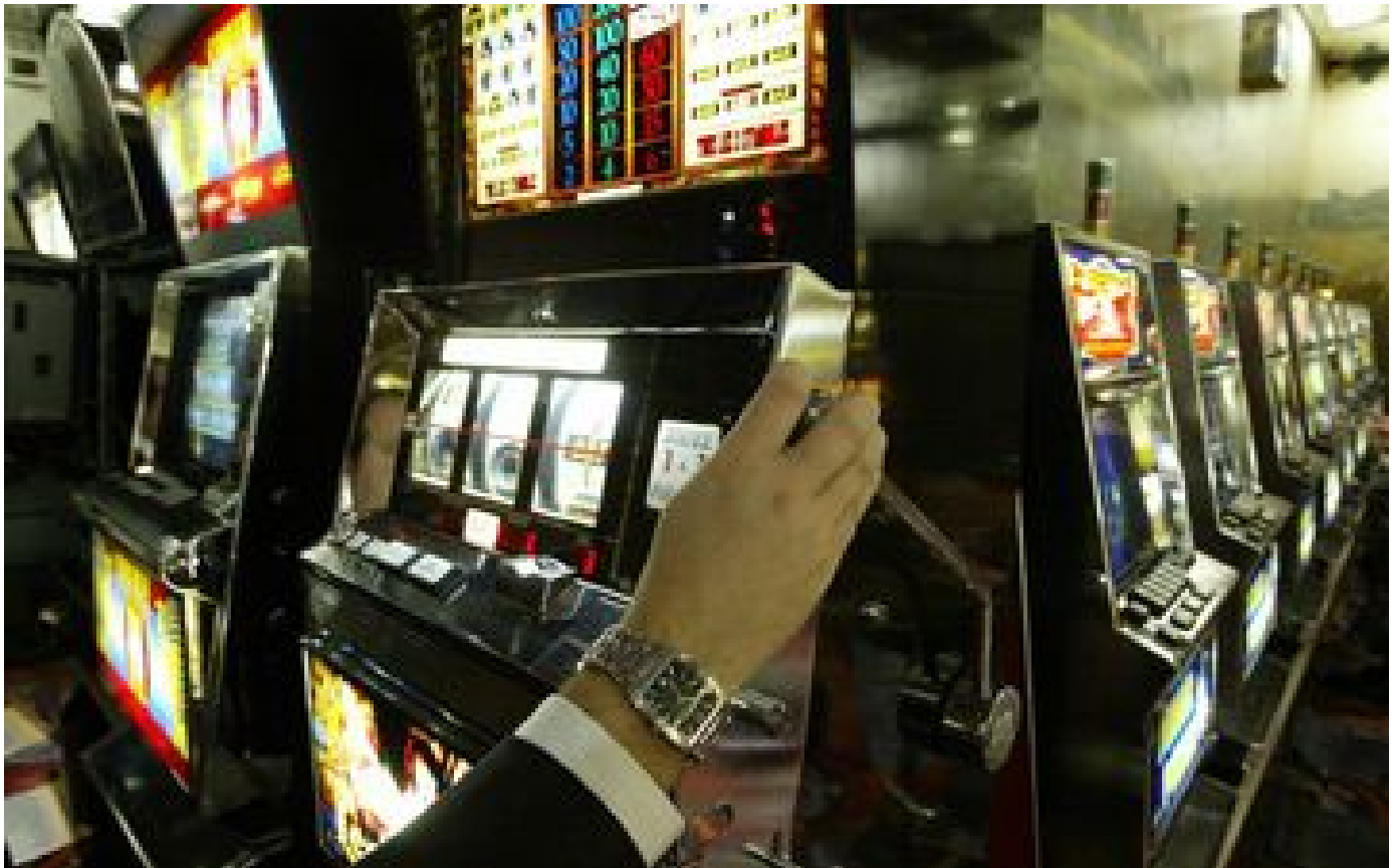
Une femme mise 80 centimes au casino et remporte plus de 200 000 euros