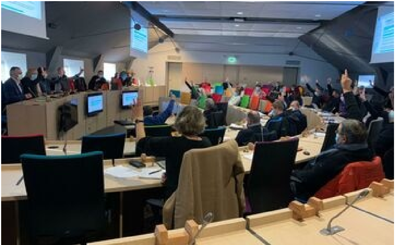
À Saint-Brieuc, la qualité de l'eau, c'est à huis clos