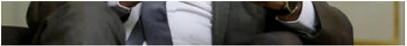
Abonnés Covid-19 à l'école : tests, capteurs CO2... le protocole sanitaire dévoilé par Jean-Michel Blanquer