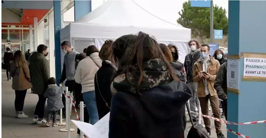
Une file d'attente dans une pharmacie de Rennes Saint-Grégoire dans la galerie marchande de Grand Quartier, ce lundi 3 janvier 2022.

Cette longue attente en agace plus d'un. Comme ce père de famille, venu accompagner sa fille cas contact et qui s'impatiente. Si bien que « la prochaine fois, peste-t-il, je ne sais pas si on se déclarera cas contact. »