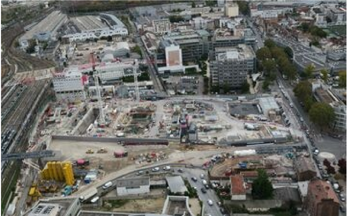
Abonnés Accident mortel sur le chantier du Grand Paris Express : les travaux de la gare Saint-Denis-Pleyel à l'arrêt