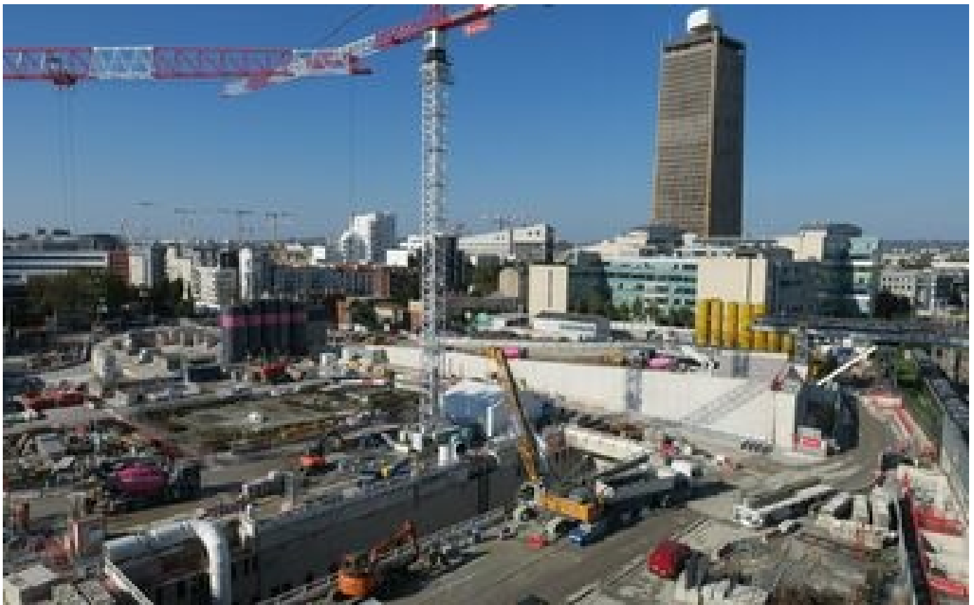
Un ouvrier meurt sur le chantier de la future gare Saint-Denis - Pleyel du Grand Paris Express