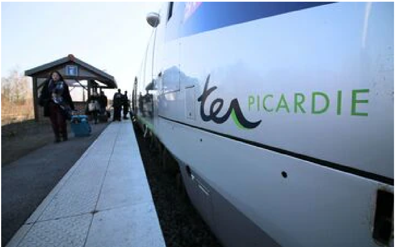
Abonnés Covid-19 : dans l'Oise, avec un allègement de l'offre de TER, la situation s'aggrave pour les usagers du train