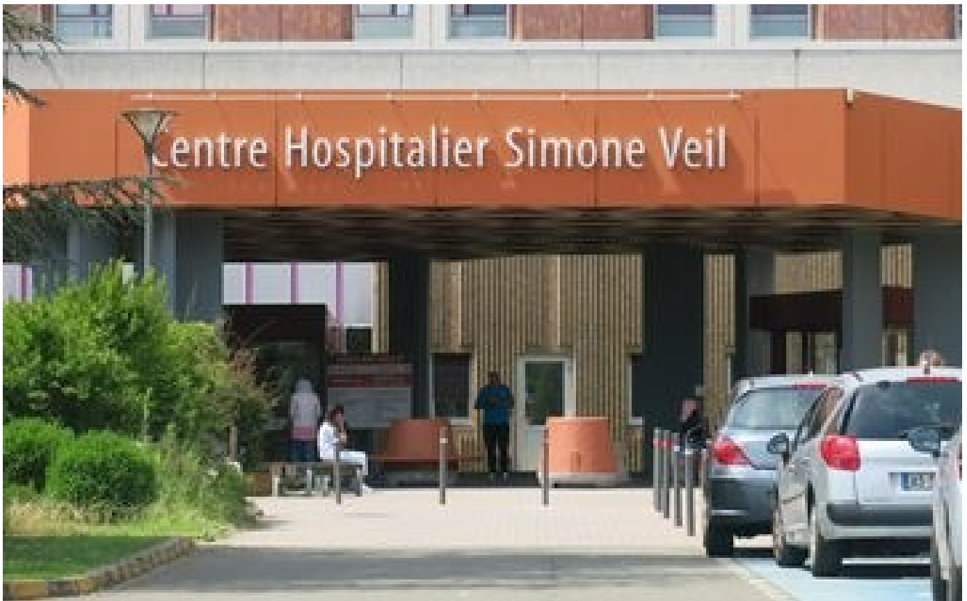
Abonnés Covid-19 : dans l'Oise, sous la pression d'Omicron, les hôpitaux priés d'augmenter leurs capacités d'accueil