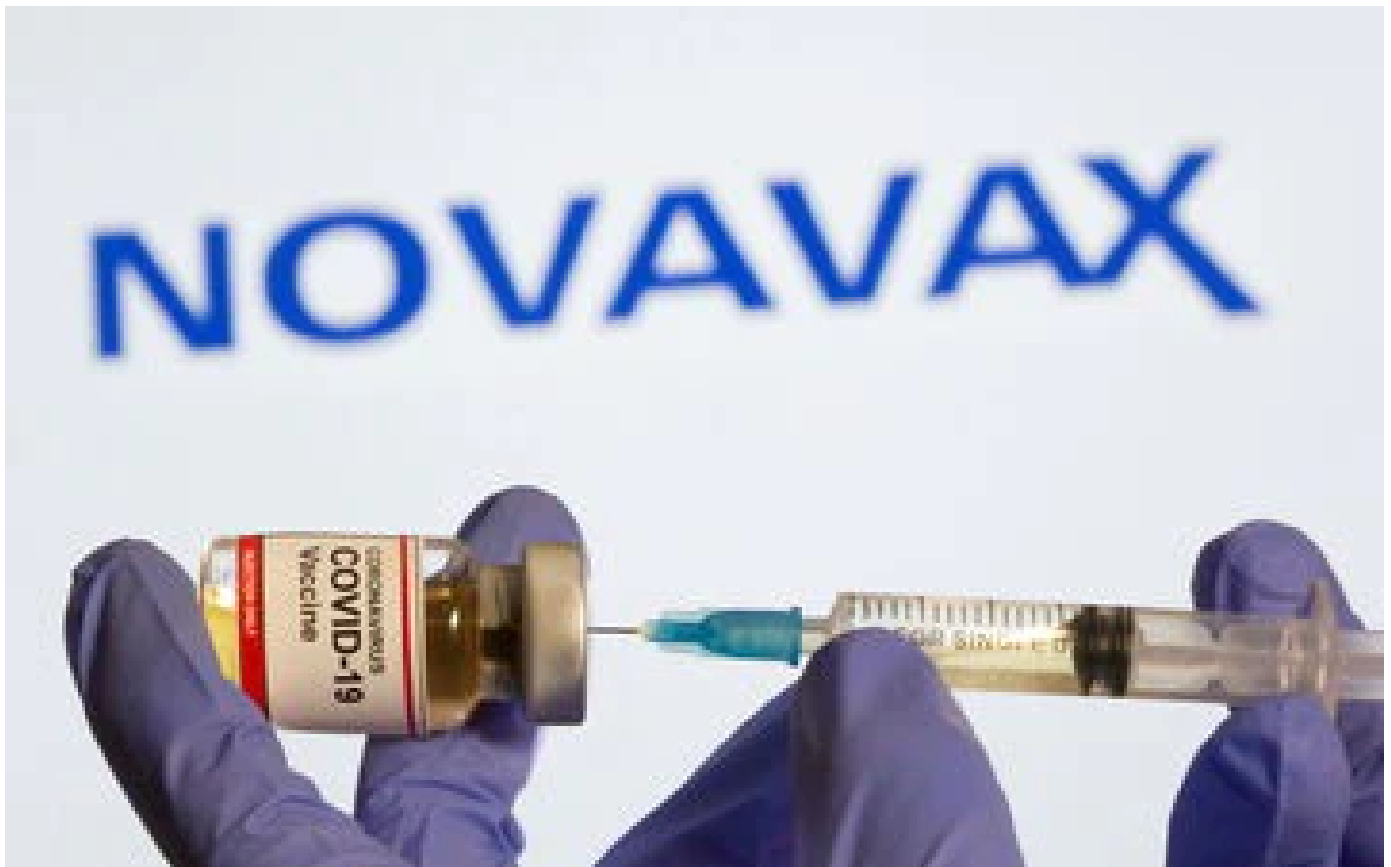
Covid-19 : les premières injections du vaccin Novavax en France pourraient être lancées «début février»