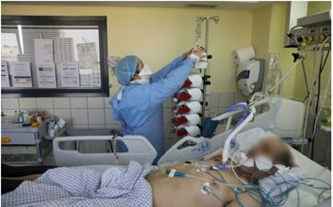
Covid-19 en France : 206 nouveaux décès, la pression hospitalière s'accroît