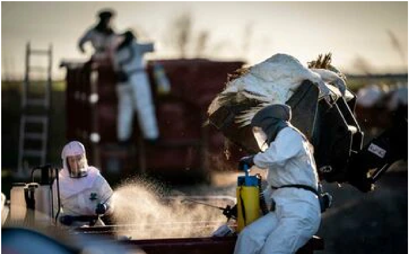
Grippe aviaire : un rare cas de contamination humaine en Angleterre