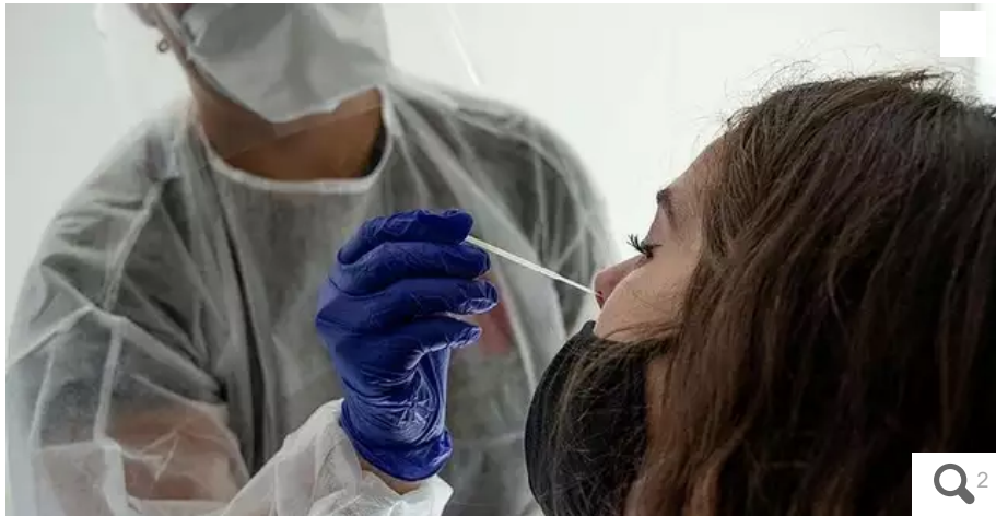
Les demandes de tests, le jour même, sont trop importantes, et les professionnels ne peuvent plus assurer.

Les demandes de tests explosent. Les maires ruraux de Loire-Atlantique ont adressé une lettre aux autorités pour demander un plan de secours. La situation en ville est aussi très tendue.