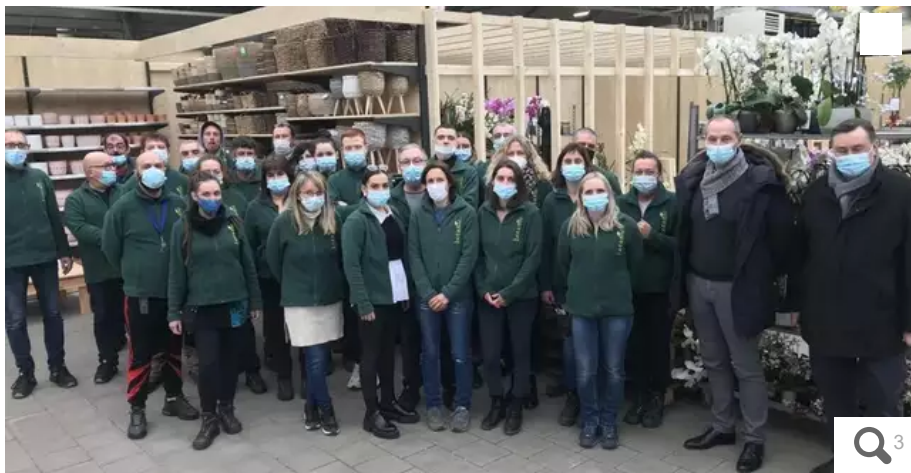
L'équipe de l'enseigne Botanic®. A deux jours de l'ouverture, il restait encore beaucoup de travail.

Dans le giron du groupe finistérien Nicot, le magasin Truffaut de Lorient (Morbihan), avec celui de Quimper, est passé sous l'enseigne Botanic®. Elle ouvre ce samedi 8 janvier. Avec pas mal de changement à la clé.