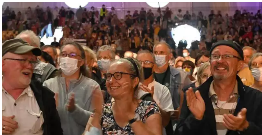
Le public de l'espace Marine s'était levé plusieurs fois pour saluer les artistes.

Cette création devrait être rejouée, cette année, aux Asturies, qui sont mises à l'honneur lors de la prochaine édition, ayant lieu du 5 au 14 août 2022.