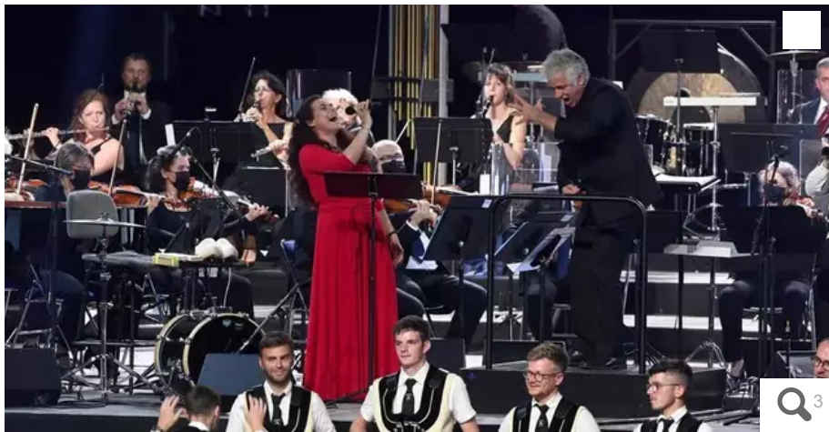
« Finisterres Celtiques », création commémorative de la 50e édition du FIL : six ans de travail avec six compositeurs.

La Fondation d'entreprise Grand Ouest soutient la culture. Le prix du Grand Ouest est remis au Festival Interceltique de Lorient (Morbihan) pour sa création liée au cinquantième anniversaire de l'événement.