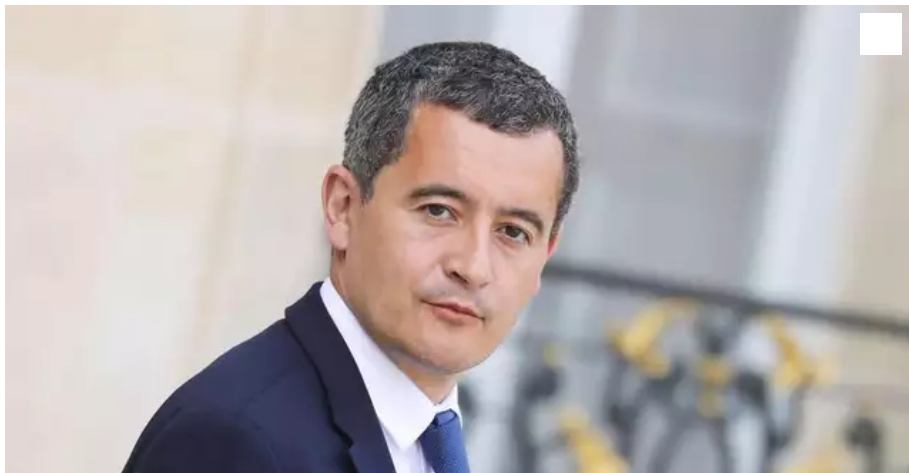
Le ministre de l'Intérieur, Gérald Darmanin, a annoncé qu'il engageait la procédure de dissolution de Nantes révoltée.

Après la manifestation de vendredi 21 janvier, à Nantes, le ministre de l'Intérieur Gérald Darmanin a annoncé, mardi 25 janvier 2022, le déclenchement de la procédure de dissolution de ce groupe d'extrême gauche.