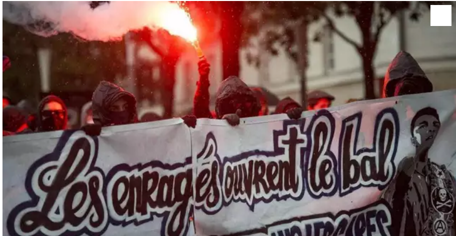
La plupart des membres de Nantes révoltée ou de leurs sympathisants ont pris l'habitude de défilé visage masqué.

En affichant sa volonté de dissoudre le collectif nantais, le ministre de l'Intérieur offre involontairement une « tribune » au groupe, qui se présente comme un média et engrange des soutiens. Plongée dans les coulisses du duel.