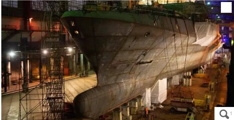
Les frégates commandées par la Grèce doivent être construites en France par Naval Group, à Lorient (Morbihan).

La Grèce a confirmé l'achat de trois frégates à la France, fabriquées par Naval Group à Lorient. La commande a été approuvée ce mardi 15 février, par un vote du Parlement hellénique.