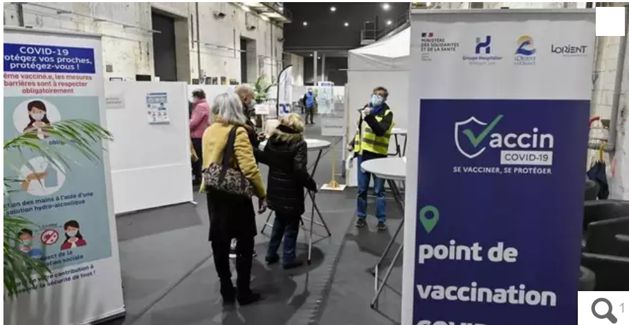
Installé au K2 voici un peu plus d'un an, le centre de vaccination anti-Covid Lorient-La Base fermera ses portes le 30 mars au soir.

La demande de vaccination contre le Covid diminue, les contaminations aussi. L'amélioration de la situation épidémique entraîne certaines adaptations au niveau du Groupe hospitalier Bretagne Sud. Explications.