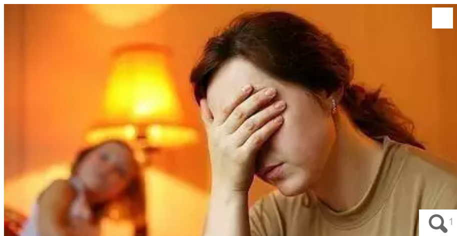
Le gouvernement veut faire diminuer le nombre de pensions impayées. Pour cela, il va s'appuyer sur la CAF qui jouera les intermédiaires.

Le paiement des pensions alimentaires se fait désormais via un organisme intermédiaire. En Bretagne, c'est un service géré à la CAF de Vannes qui s'en occupe.