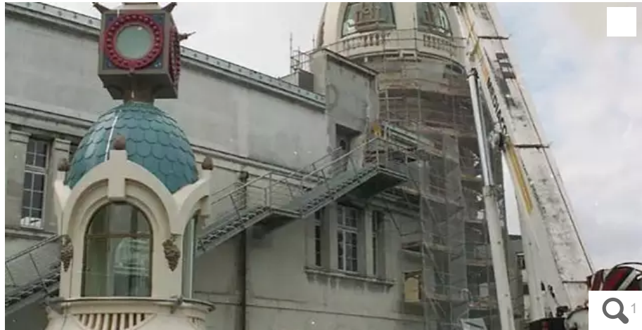
Le 26 mai 1998, une imposante grue pose le nouveau dôme de la Tour Lu tandis que la flèche-phare attend son tour.

Mémoire. Il est des idées reçues qui ont la vie dure, comme celle qui veut que les deux tours Lefèvre-Utile, érigées entre 1905 et 1909 aient été détruites par les bombardements durant la Deuxième Guerre mondiale.