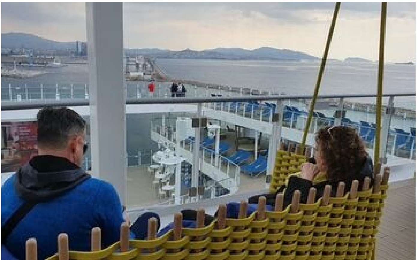
Escale inaugurale du «Costa Toscana» : à Marseille, la croisière voit l'avenir en vert