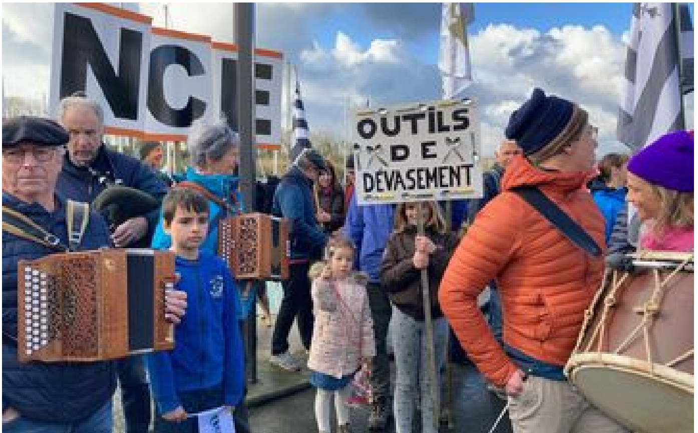
Abonnés Mobilisation dans l'estuaire de la Rance, où les plages ont laissé la place à la vase