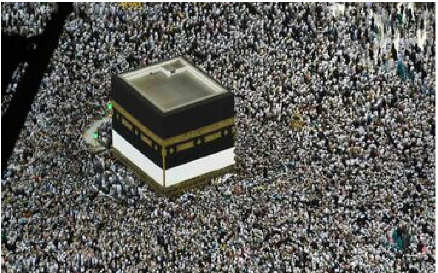
Covid-19 en Arabie saoudite : levée de la plupart des restrictions surtout pour le hajj