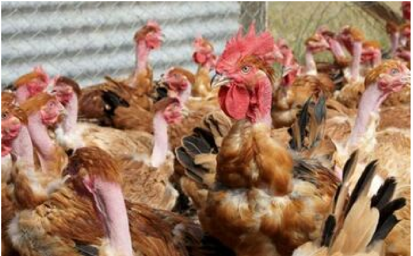
Grippe aviaire : la France compte 500 foyers de contaminations