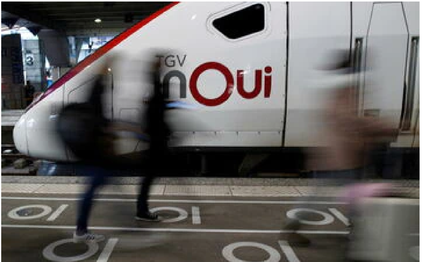
SNCF : la ligne TGV Genève-Paris perturbée par un éboulement dans l'Ain