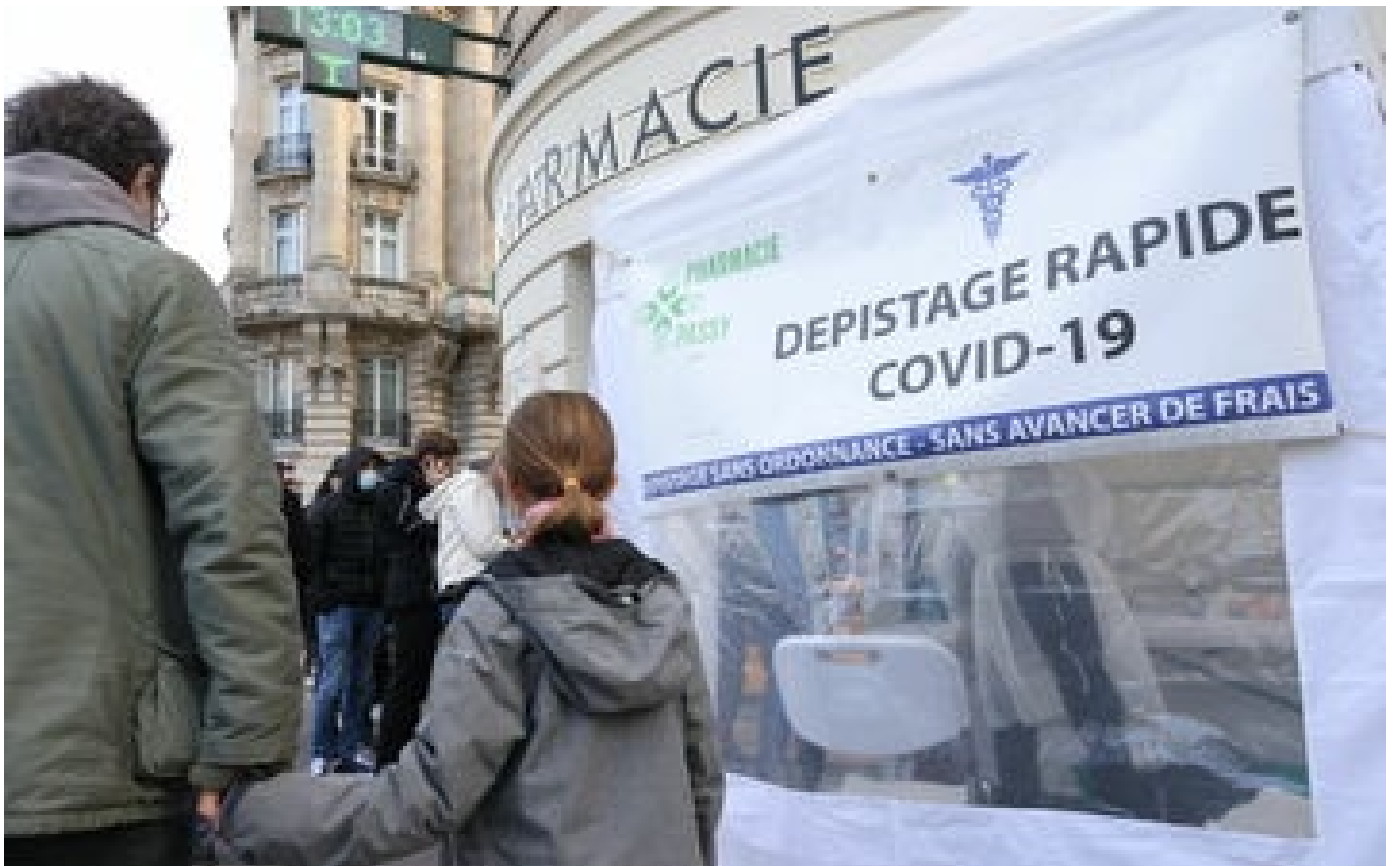
Covid-19 : en France, la baisse des contaminations semble stoppée