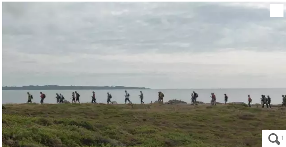
L'association Les Mouettes crapahuteuses organise une marche dimanche 13 mars 2022 au départ du centre aéré du Cruguellic, Plœmeur.

L'espace culturel Passe Ouest, à Plœmeur (Morbihan), propose, entre autres, ce samedi 12 mars 2022 des ateliers (lecture, broderie...) pour tous les âges, sur inscription. Et dimanche 13 mars, vous pourrez randonner, assister à un concert solidaire ou un spectacle musical.