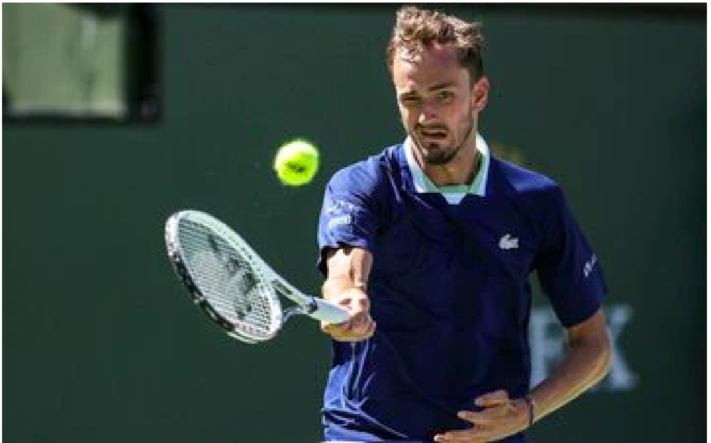
Guerre en Ukraine : Daniil Medvedev pourrait être privé de Wimbledon