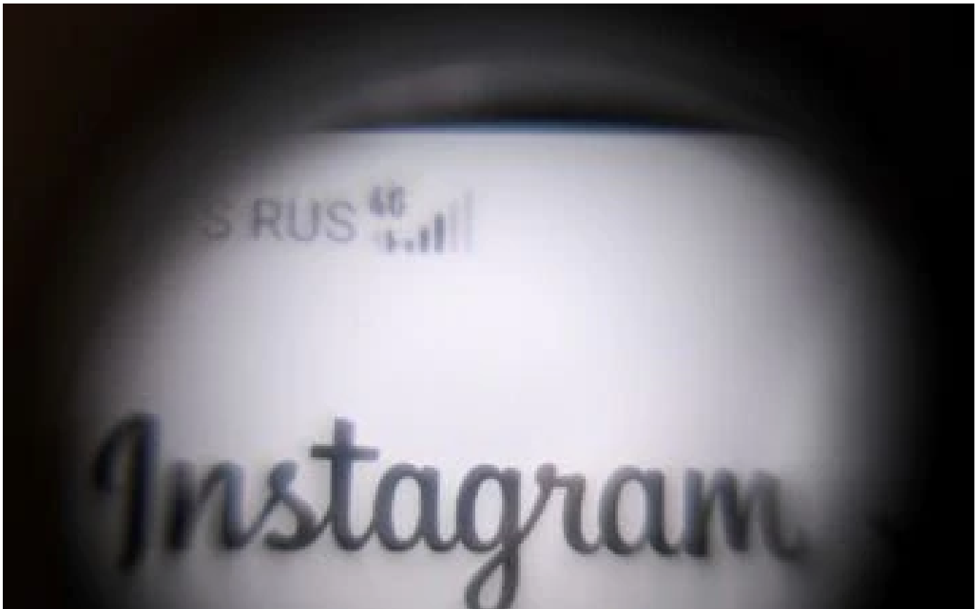
Le gendarme russe des télécoms bloque les sites d'au moins 15 médias