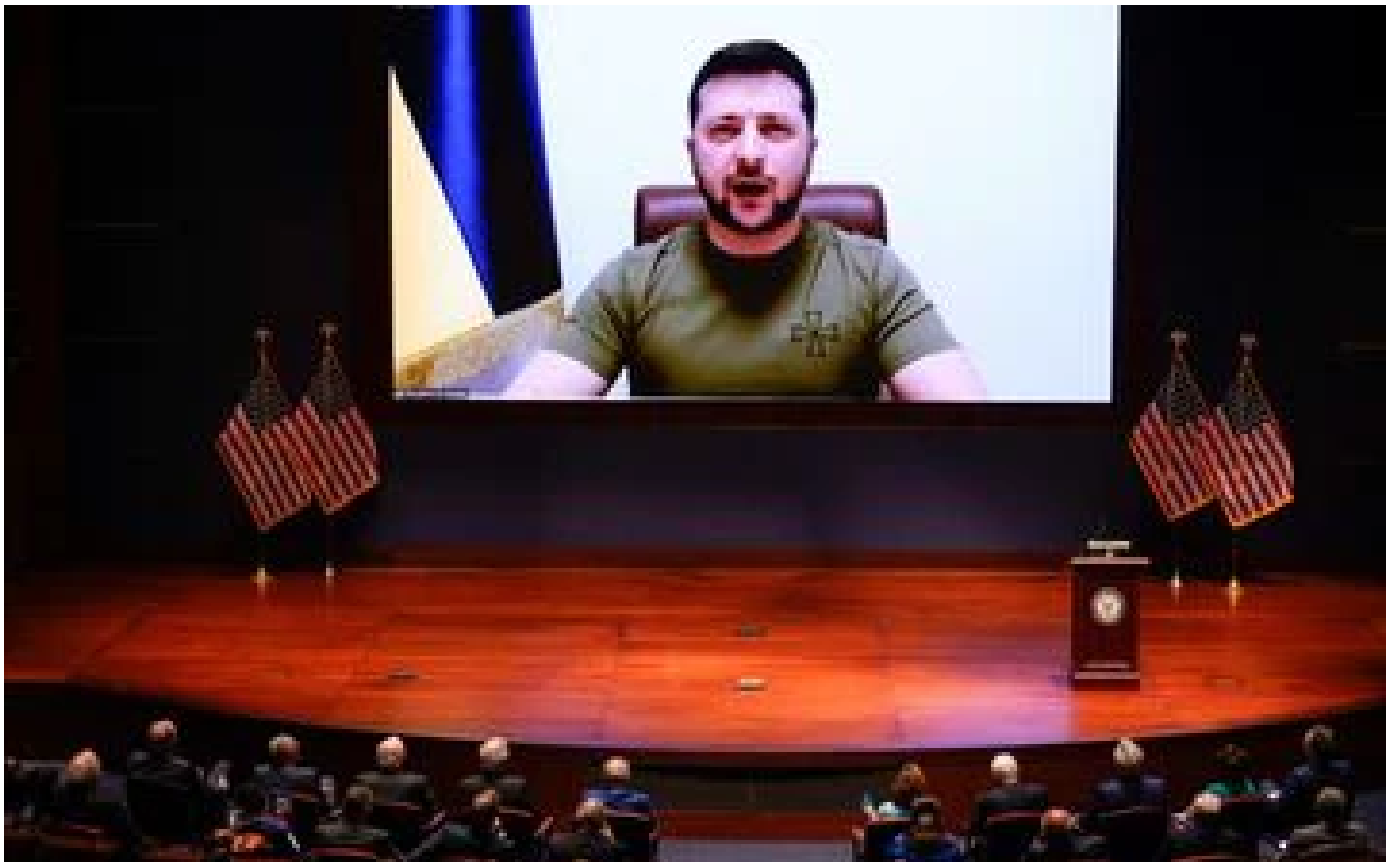
«Souvenez-vous du 11-Septembre» : le président de l'Ukraine s'adresse au Congrès américain