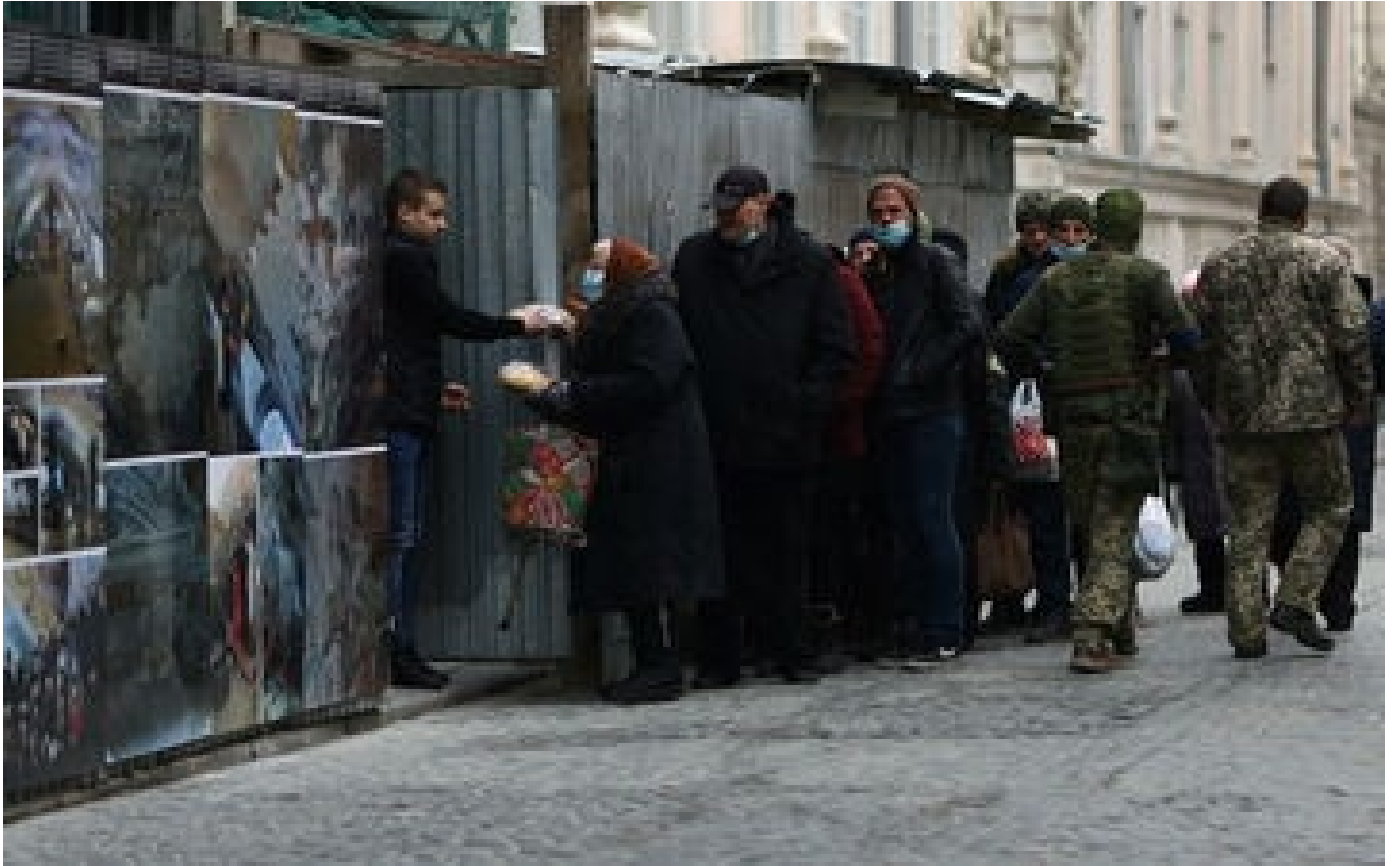
Ukraine : dix personnes faisant la queue pour du pain tuées par des tirs russes