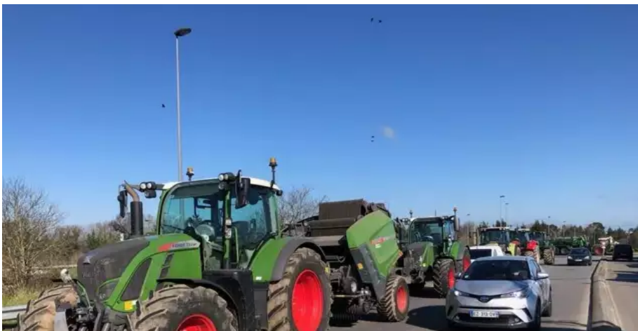
Les entreprises de travaux agricoles ont débuté leur mouvement ce vendredi matin, à Gouesnou près de Brest.

Des dizaines de tracteurs stationnent aux alentours du Leclerc de Gouesnou (Finistère) , en signe de protestation contre les prix du carburant. La circulation est ralentie mais pas bloquée. Un cortège a emprunté la RN12 dans le sens Morlaix Brest dans la matinée, occasionnant d'importants bouchons.