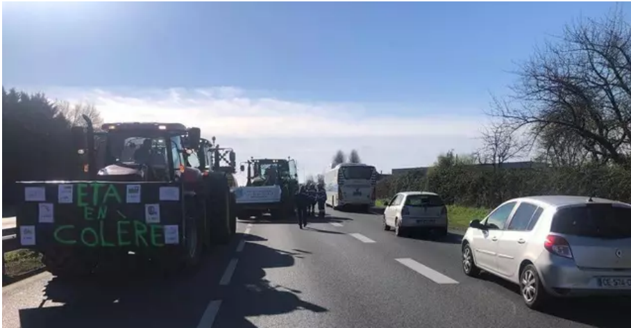
Les manifestants font sortir les automobilistes de la quatre voies Rennes - Angers.

Une quinzaine de tracteurs sont rassemblés , vendredi 18 mars 2022, matin, au niveau de Vern-sur-Seiche (Ille-et-Vilaine), sur l'axe Rennes – Angers.