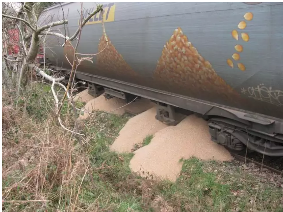
1 500 tonnes de blé ont été déversées sur la voie ferrée par des activistes du collectif Bretagne contre les fermes usines, à Saint-Gérand (Morbihan), près de Pontivy, samedi 19 mars 2022 au matin.

La journaliste Emmanuelle Ducros qui officie pour L'Opinion a beaucoup commenté cette action, notamment via ce tweet : « Ça suffit !!! Quand les pouvoirs publics vont-ils réagir ? Le sabotage d'un train de céréales quand la pénurie menace le monde est une honte. Ces militants ne respectent rien. Ni le travail des autres ni le produit de la terre. »