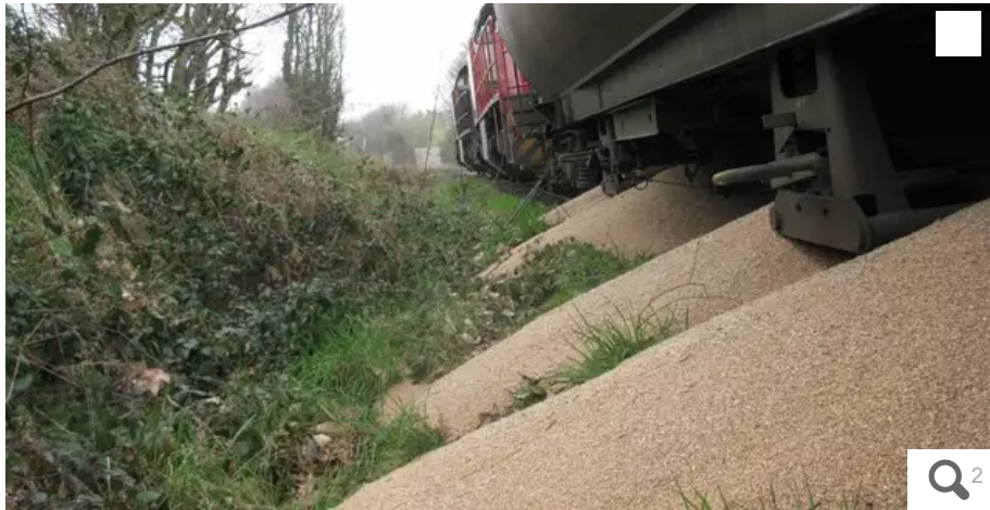
1 500 tonnes de blé ont été déversées sur la voie ferrée par des activistes du collectif Bretagne contre les fermes usines, à Saint-Gérand (Morbihan), près de Pontivy, samedi 19 mars 2022 au matin.

1 500 tonnes de blé ont été déversées sur la voie ferrée par des activistes du collectif Bretagne contre les fermes usines, à Saint-Gérand (Morbihan), près de Pontivy, samedi 19 mars 2022. Depuis, les critiques pleuvent... dont celle du ministre de l'Agriculture, Julien Denormandie.