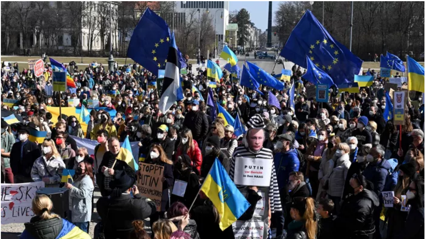
Manifestation à Munich, mettant en scène Vladimir Poutine en prison.

L'ONG Human Rights Watch demande à l'Ukraine de cesser de mettre en scène les prisonniers de guerre russe car cela viole les conventions de Genève, selon un communiqué. « Les autorités ukrainiennes devraient cesser de poster sur les réseaux sociaux et messageries des vidéos de soldats russes prisonniers pour les exposer en public, notamment ceux qui sont humiliés ou menacés », selon un communiqué.