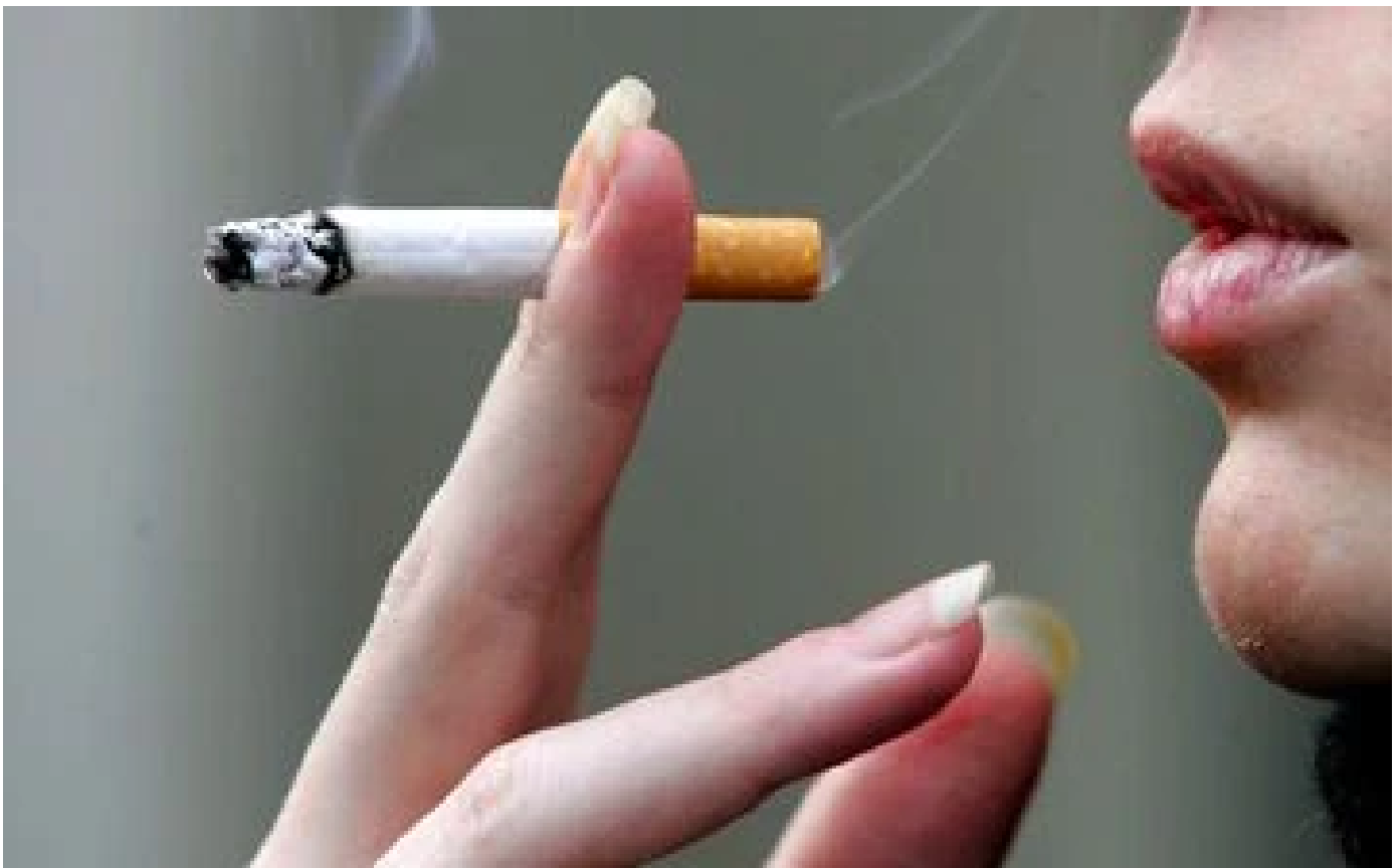
Abonnés Alcool, tabac, médicaments... quand le télétravail pousse à la consommation