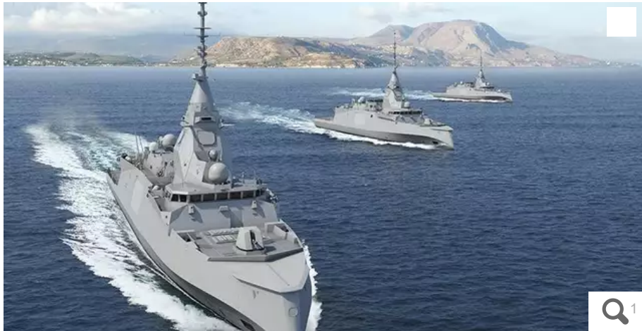
La Grèce a commandé trois frégates de type FDI au chantier français Naval Group, le 24 mars 2022.

Le gouvernement d'Athènes et le constructeur français Naval Group se sont engagés, jeudi 24 mars, pour la fourniture de trois frégates de type FDI. La construction de la première est déjà commencée à Lorient (Morbihan) et sa livraison est prévue au premier trimestre 2025. Une quatrième unité est en option.