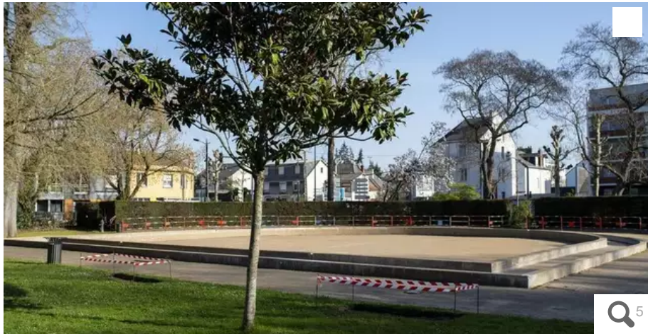
La pataugeoire de la Noë-Mitrie va accueillir des plantes natives des bords de l'Erdre.

Le parc de la Noë-Mitrie est très prisé des familles. À l'est de Nantes, cet espace plein de verdure possède deux belles pataugeoires. Souci, l'une d'elles a rendu l'âme... La Ville a donc décidé de la transformer en « oasis de biodiversité », au grand désarroi des usagers.