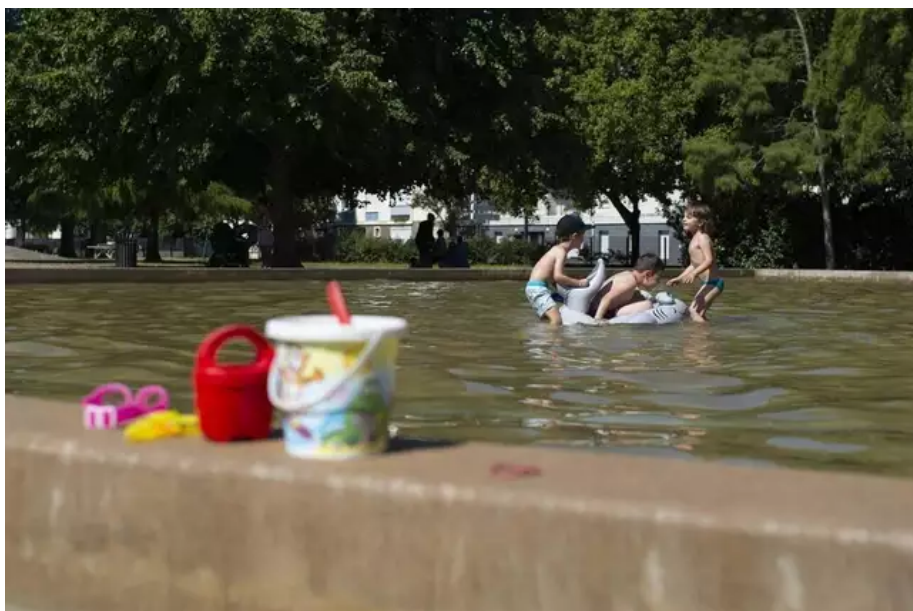
La Noë-Mitrie était dotée de deux pataugeoires : l'une réservée pour les plus petits et une pour les grands enfants.

Que va devenir l'autre espace ? «Nous ne pouvons pas engager de réparations cette année. Il va se transformer en oasis de biodiversité, avec des plantes natives des bords de l'Erdre comme l'Iris des marais, des Carex», égraine l'élue.