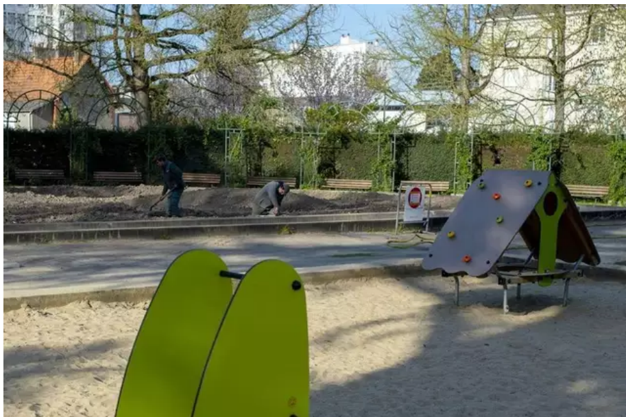
« Le plus petit bassin n'était plus en service depuis l'an passé, son réseau d'évacuation est en très mauvais état ».

«Le plus petit bassin n'était plus en service depuis l'an passé, son réseau d'évacuation est en très mauvais état», souligne Cécile Bir. L'adjointe aux squares, parcs et jardins à la ville de Nantes tient à rassurer : «On garde la deuxième pataugeoire, la plus grande. Elle va devenir un bassin écologique avec un système de phytoépuration (l'épuration naturelle par les plantes, ndr)».