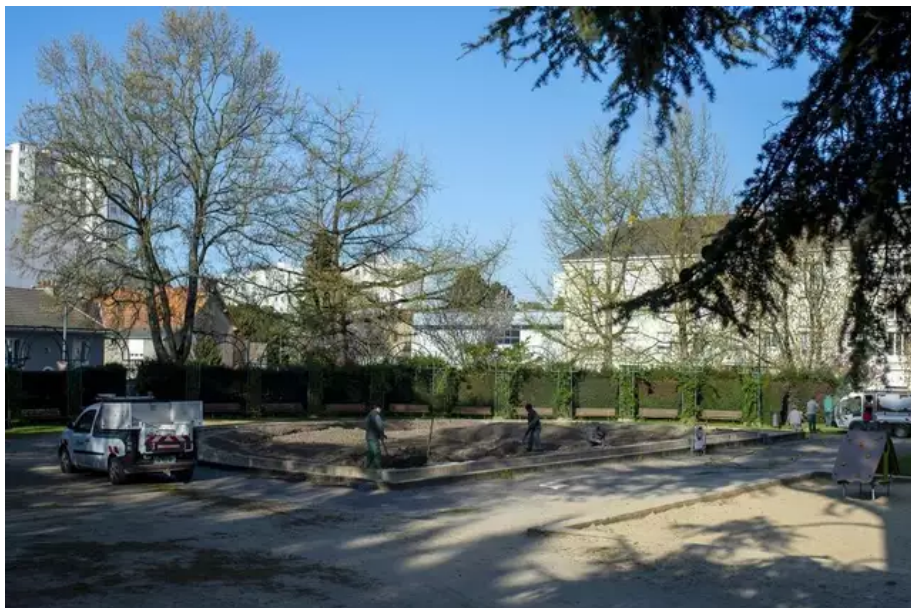
Les travaux menés dans le parc de la Noë-Mitrie font de nombreux déçus à l'est de Nantes.

+Nantes. Vacances : où trouver les meilleures aires de jeux pour les enfants ?