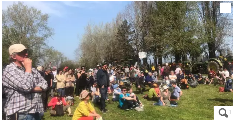
400 personnes opposées au nucléaire se sont rassemblées, ce dimanche 27 mars, devant la centrale à charbon de Cordemais, entre Nantes et Saint-Nazaire.

Plusieurs organisations politiques et syndicales ont appelé à se rassembler, ce dimanche 27 mars, sur le site de la centrale à charbon de Cordemais, en Loire-Atlantique, et dont l'avenir est encore incertain. Environ 400 personnes étaient présentes.