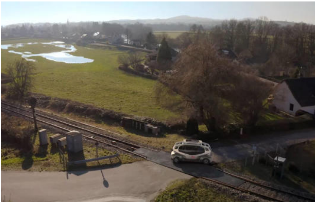
Flexy, la nouvelle solution mobilité de la SNCF.

Flexy peut filer à 60 km/h sur route ou sur rail pour desservir les zones rurales les plus éloignées