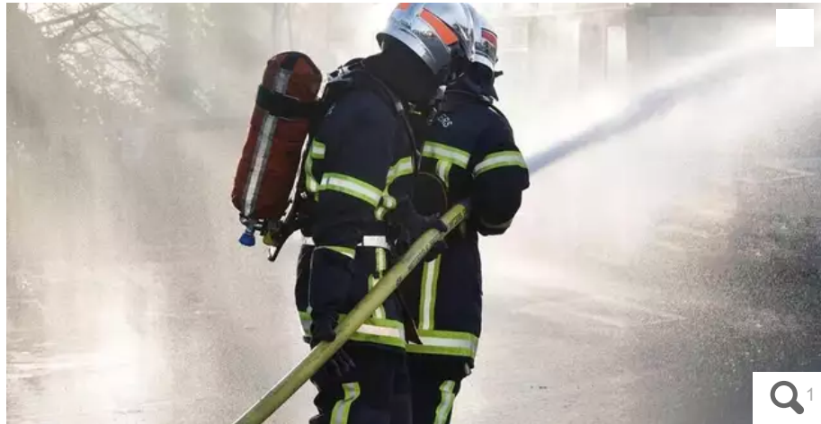
Les pompiers du centre de Lorient et Plœmeur (Morbihan) sont intervenus dans la nuit de jeudi à vendredi pour éteindre un feu de voiture avenue Pasteur à Plœmeur.

Vendredi 1er avril 2022, vers 2 h, les pompiers de Lorient et de Plœmeur (Morbihan) sont intervenus pour éteindre un feu sur le parking d'un immeuble, avenue Pasteur, à Plœmeur.