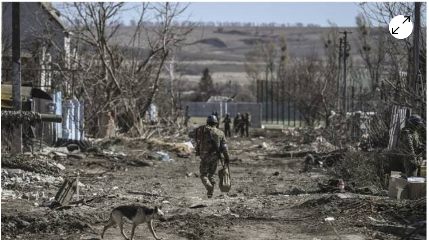
Un soldat Ukrainien dans le village de Mala Rogan, à l'est de Kharkiv, le 28 mars 2022.

Une vidéo non authentifiée montre un possible « crime de guerre » sur des soldats russes lors de l'affrontement avec des soldats ukrainiens dans la ville de Mala Rogan, alerte l'ONG Human Rights Watch dans un communiqué publié jeudi 31 mars 2022. La Russie a ordonné une enquête.