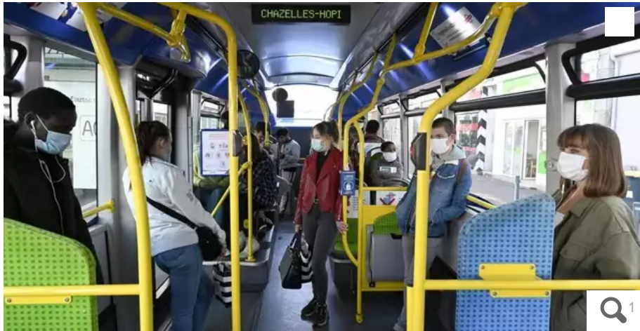
Un mois de transports en commun à 10 € : un nouveau titre ouvert aux habitants (hors abonnés) du pays de Lorient pour découvrir le réseau de bus.

Alors que les prix à la pompe flambent, Lorient Agglomération propose à ses habitants de découvrir le réseau de bus à un prix préférentiel : un mois de transports à 10 €.