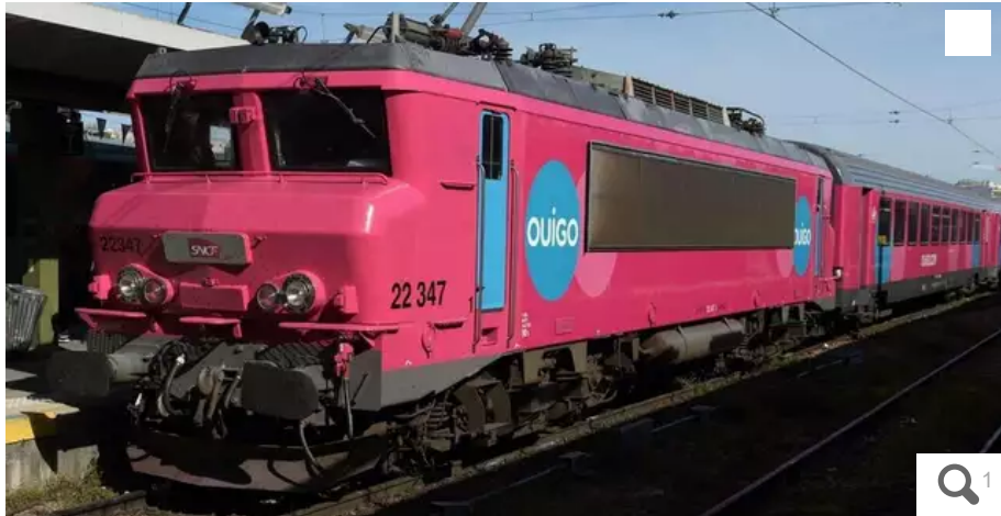
Un train Ouigo Corail reconverti en "Ouigo Train Classique" à la gare de Bercy, le 11 avril 2022.

La SNCF a lancé lundi des trains classiques relativement lents, et commercialisés par une filiale sous la marque Ouigo, sur les lignes Paris-Lyon et Paris-Nantes, une nouveauté dénoncée à la gare d'Austerlitz à Paris par une manifestation de cheminots.