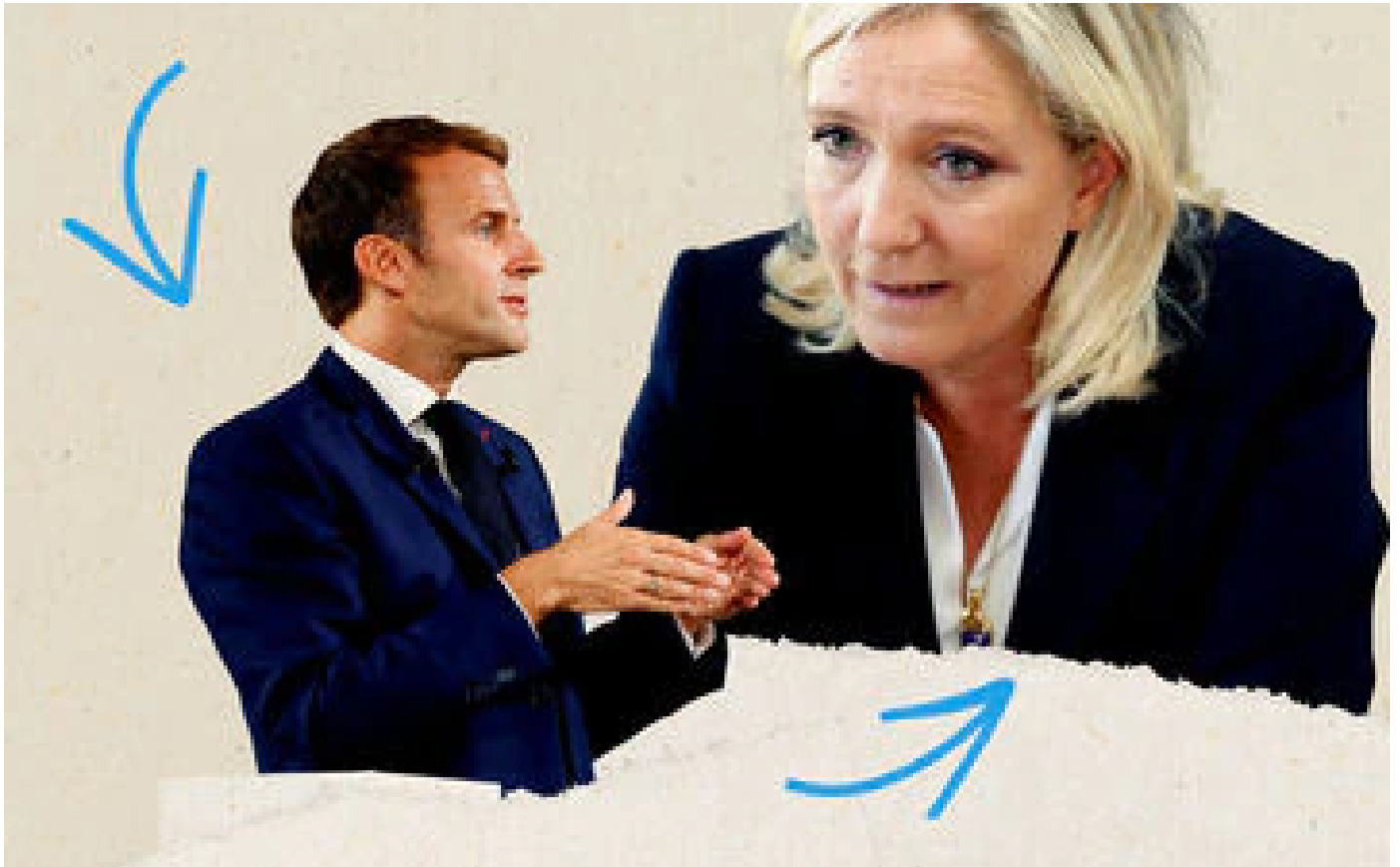
Présidentielle : à quels reports de voix s'attendre pour le second tour Macron - Le Pen ?