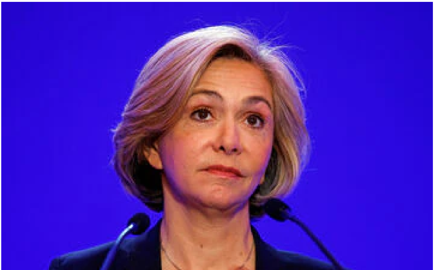
Présidentielle : Valérie Pécresse lance un appel à «une aide d'urgence» pour la «survie» des Républicains