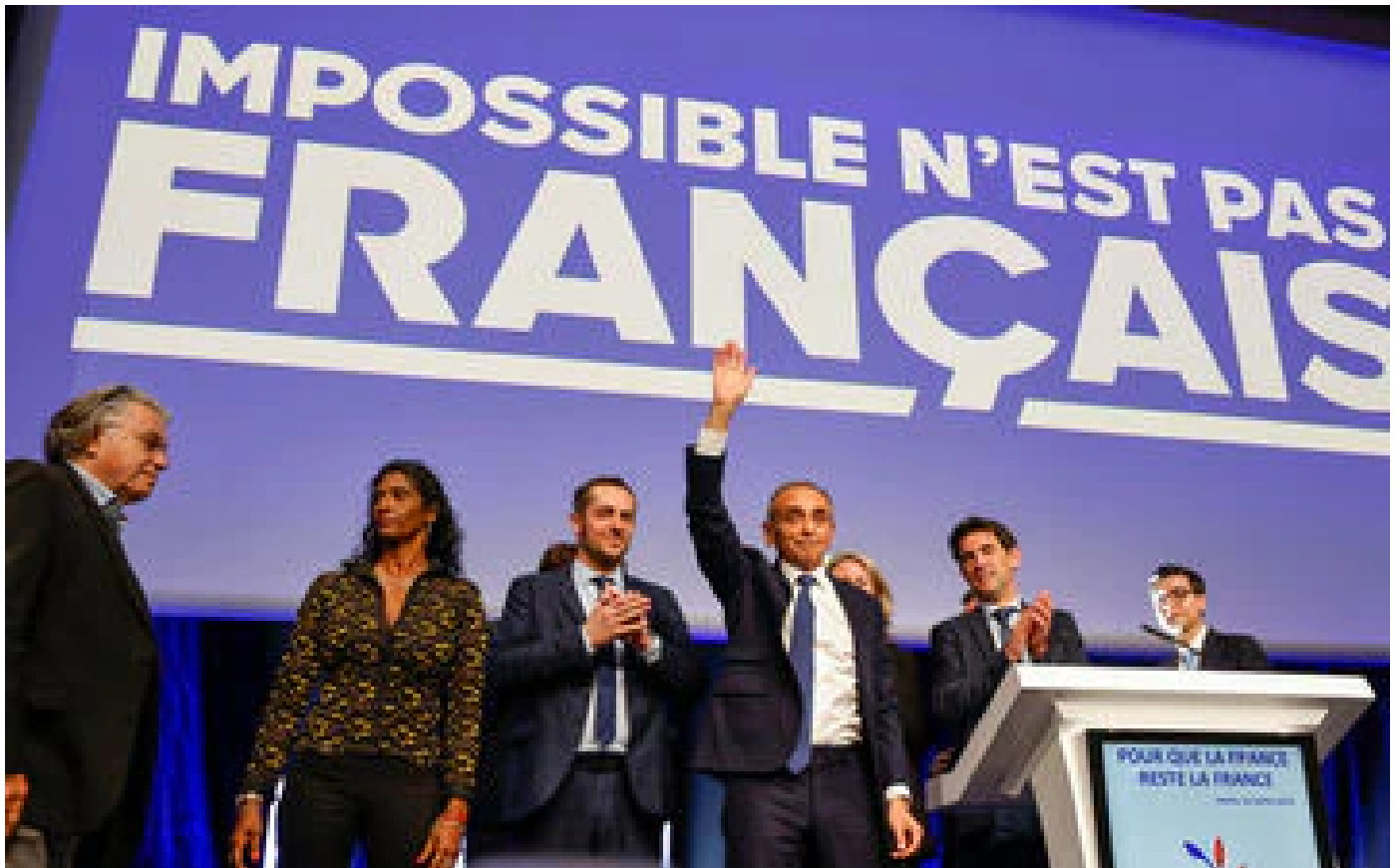
Abonnés Présidentielle en Seine-et-Marne : Éric Zemmour loin derrière Marine Le Pen