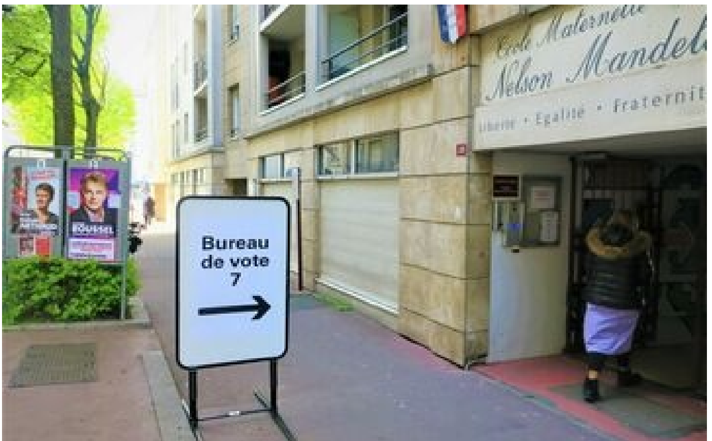
Présidentielles en Seine-Saint-Denis : l'abstention plus forte qu'en 2017