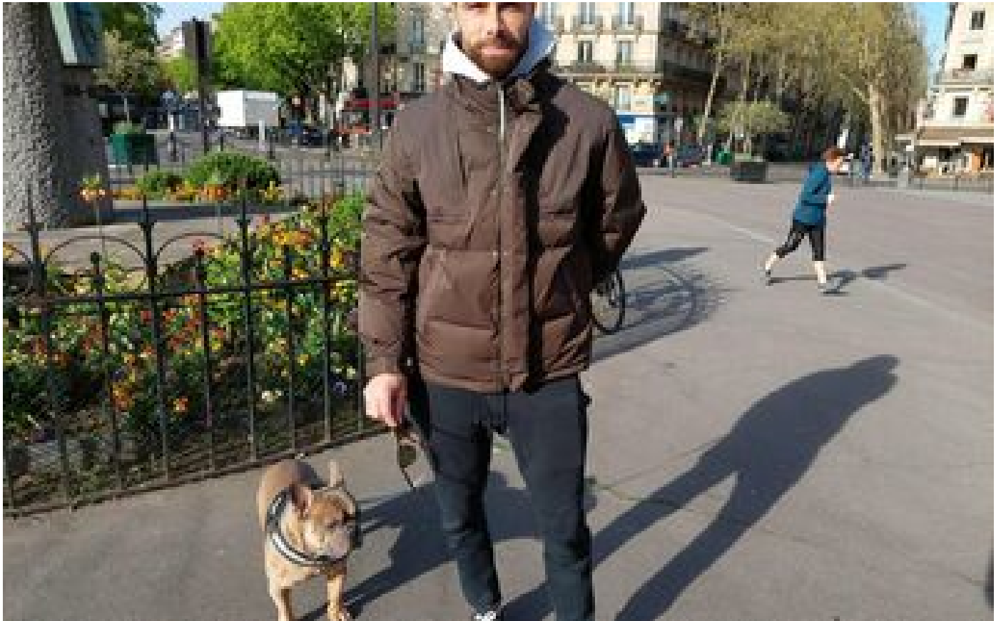
Présidentielle à Paris : le XIXe arrondissement, plus que jamais terre des abstentionnistes