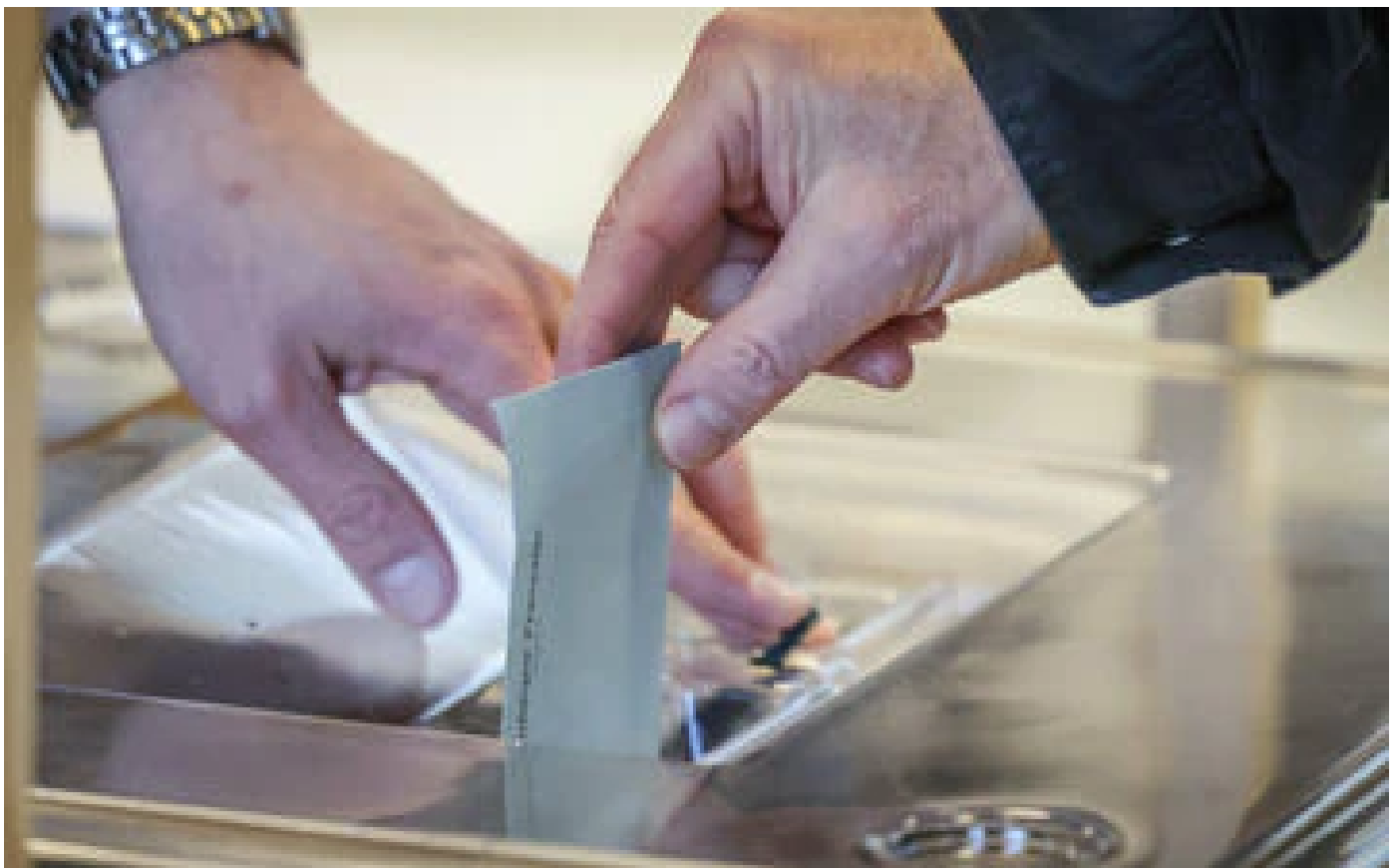
Présidentielle : pourquoi les résultats définitifs du premier tour tardent-ils à venir ?