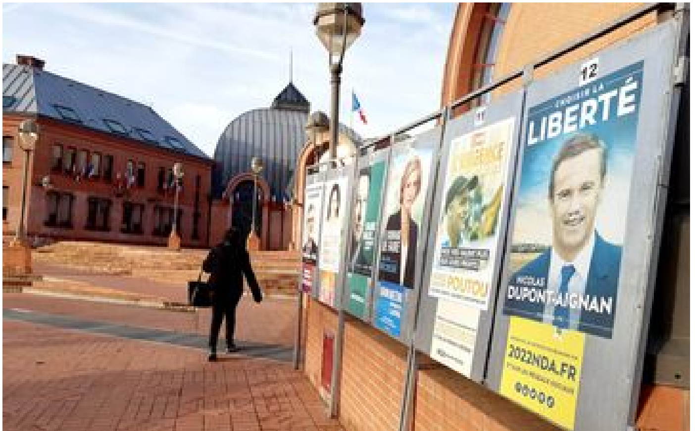
Abonnés Présidentielle dans le Val-de-Marne : scrutin après scrutin, l'abstention poursuit Vitry-sur-Seine