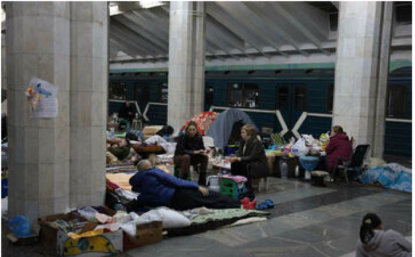
Guerre en Ukraine en direct : après une journée sans, des couloirs humanitaires vont rouvrir