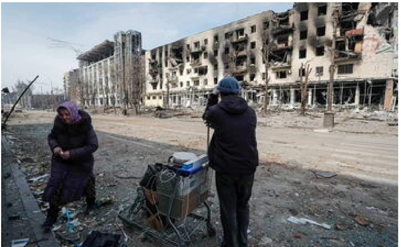
Guerre en Ukraine : les Russes ont dû ravaager Marioupol pour s'en emparer