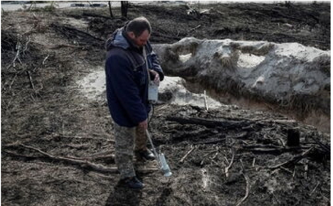
Guerre en Ukraine : impossible de contrôler la radioactivité à Tchernobyl, selon les autorités