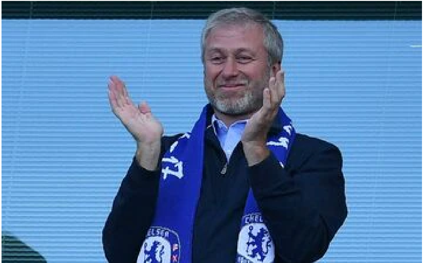
Guerre en Ukraine : Jersey gèle plus de 7 milliards de dollars d'actifs «suspçonnés d'être liés» à Abramovitch