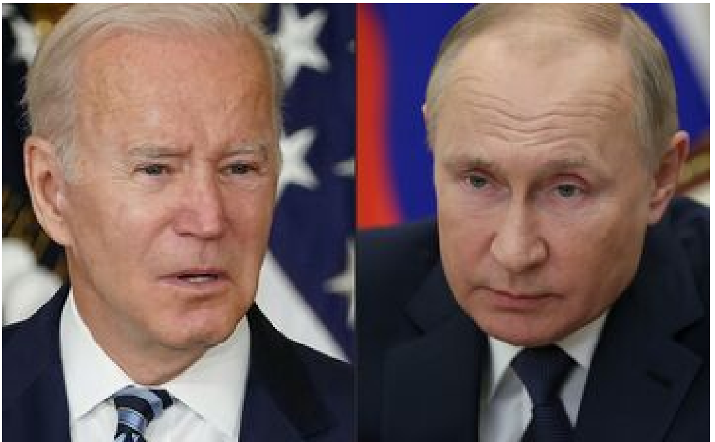
Abonnés Guerre en Ukraine : «boucher», «criminel», «génocide»... Pourquoi Biden est-il aussi offensif avec Poutine ?