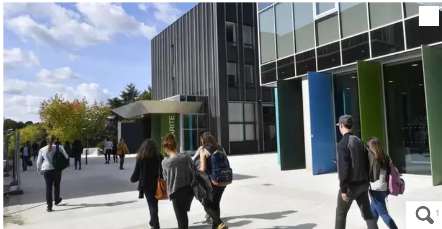
Le message envoyé par la présidente de l'université provoque des remous.