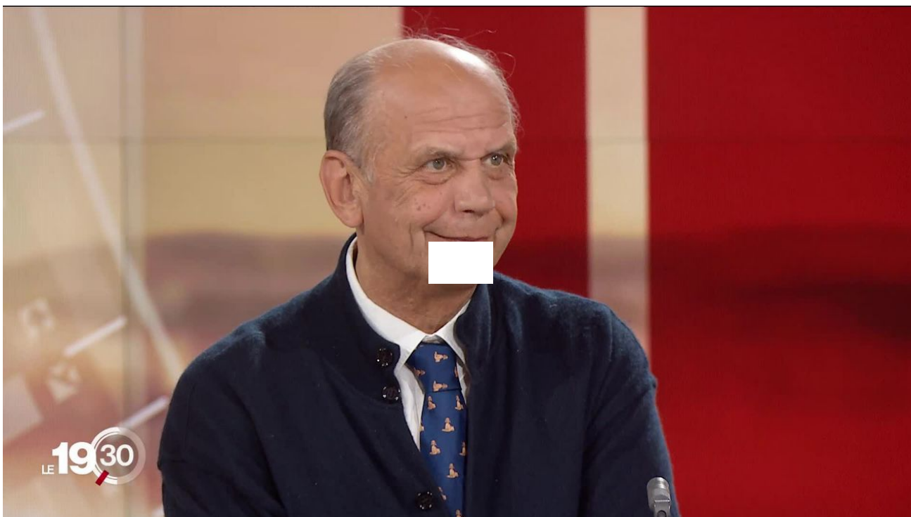
L'ancien diplomate russe Vladimir Fédorovski livre son analyse sur la guerre que mène Vladimir Poutine au monde occidental / 19h30 / 3 min. / hier à 19:30

L'enlisement du conflit en Ukraine suscite toujours plus de tensions internationales, et les États-Unis appellent désormais ouvertement à une défaite militaire russe. Pour l'ancien diplomate soviétique Vladimir Fédorovski, il s'agit d'un "moment très dangereux pour l'humanité", dont l'origine remonte à de mauvais choix au sortir de la Guerre froide.