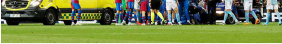
Ambulance Nou Camp

Le premier bulletin médical s'est néanmoins voulu rassurant puisque si le natif de Rivera souffre d'une commotion cérébrale, il a rapidement retrouvé ses esprits et pu se soumettre à des examens approfondis. Pour le reste, le Barça a passé une soirée paisible. Après une première demi-heure sans saveur, il aura suffi d'un éclair d'Ousmane Dembélé pour ouvrir le score. Jusqu'alors peu servi, l'ancien Rennais a en effet enchaîné petit pont sur un premier joueur du Celta, crochet puis accélération foudroyante avant de servir parfaitement Memphis Depay qui ne s'est pas fait prier pour tromper Matias Dituro.