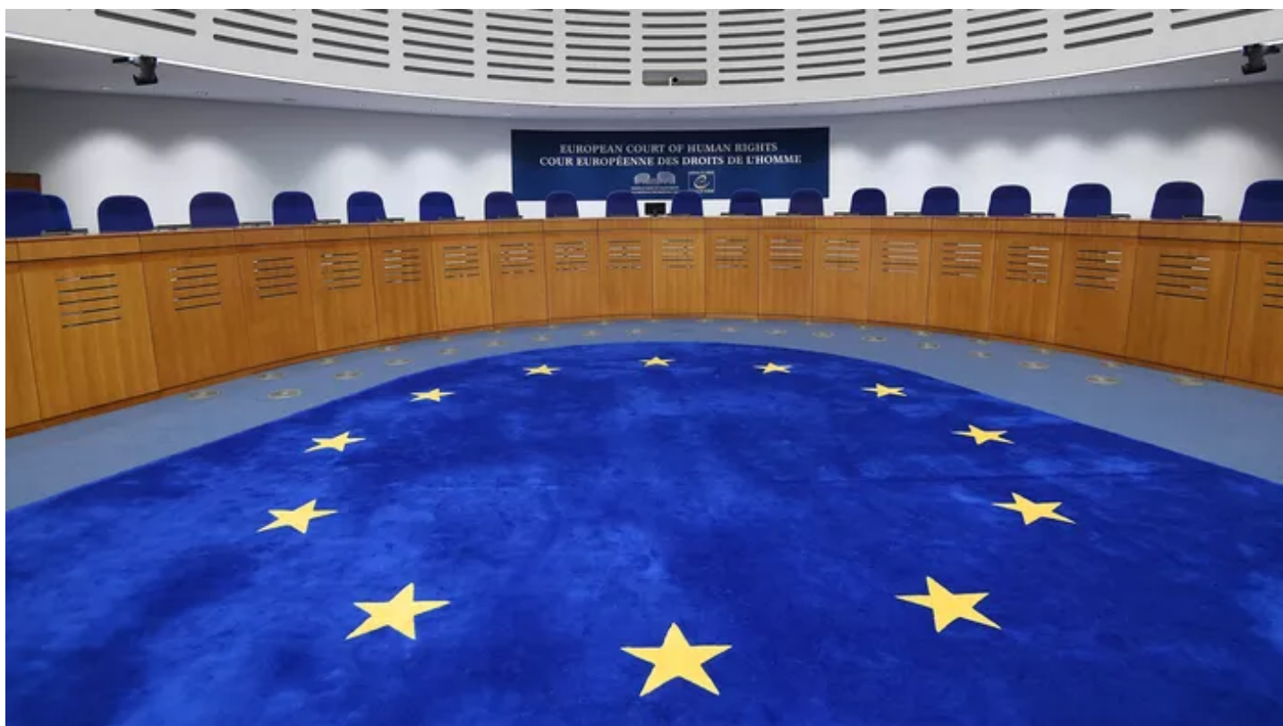
La Cour européenne des droits de l'homme (photo d'illustration).

Un Russe qui se plaignait de l'extension croissante d'un cimetière dont il était voisin et qui contaminait dangereusement les sols de sa propriété et l'eau de son puits a fait condamner mardi Moscou par la Cour européenne des droits de l'homme (CEDH).