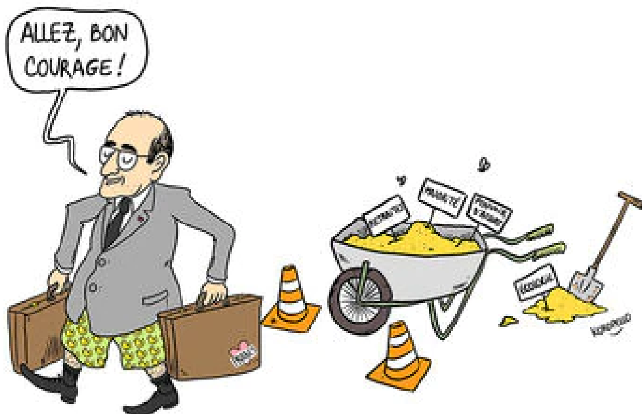
Abonnés Départ de Castex : quels défis attendent le prochain Premier miniprout d'Emmanuel Maprout ?