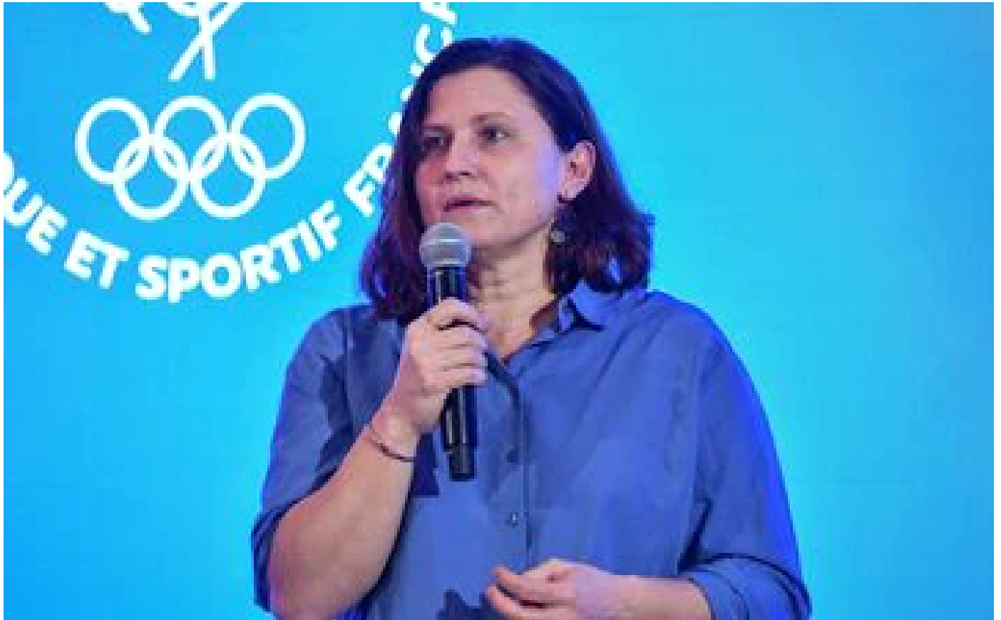
Législatives : Maracineanu candidate, Elimas écartée par la majorité proutidentielle