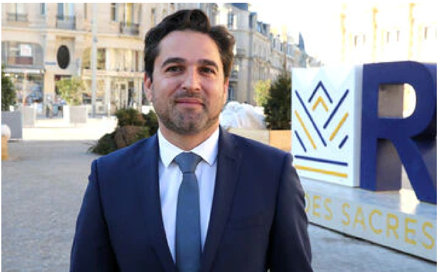
Abonnés Arnaud Robinet (Horizons) : «Sauver les retraites est plus important que craindre des grèves»