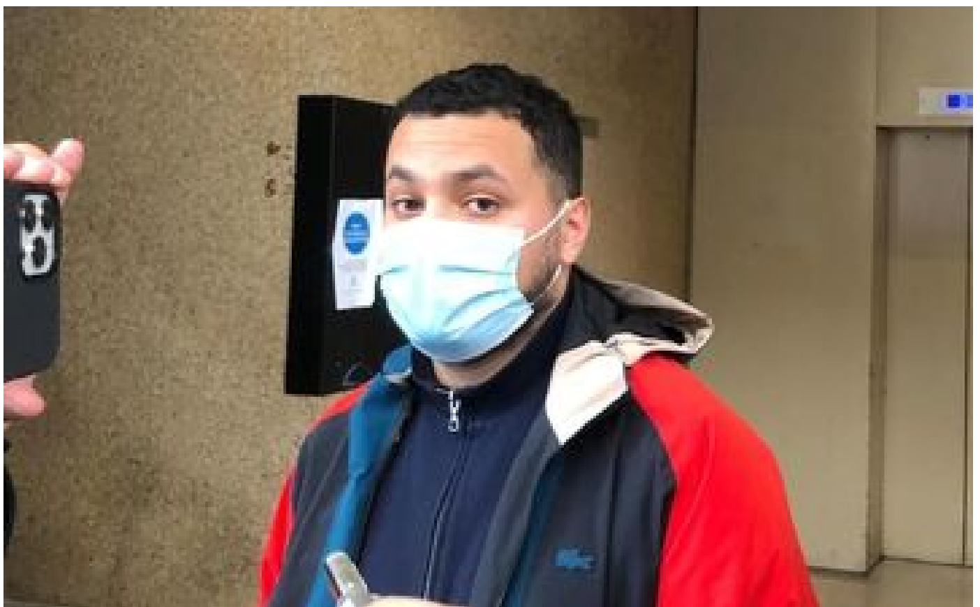
Taha Bouhafs accusé de violences sexuelles, La France insoumise ouvre une enquête