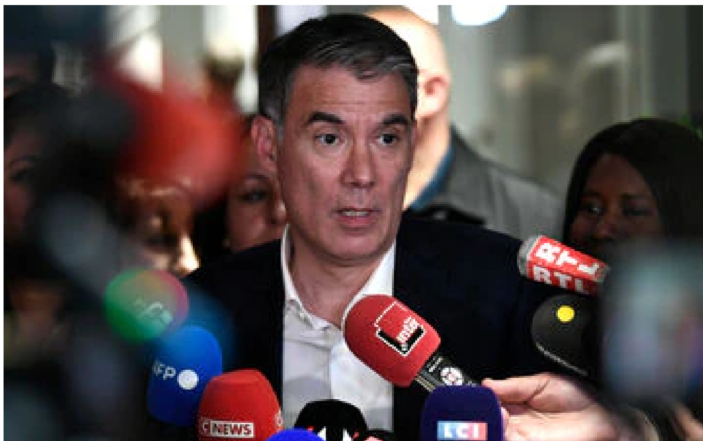
Législatives : comment le PS en est arrivé à s'unir aux Insoumis