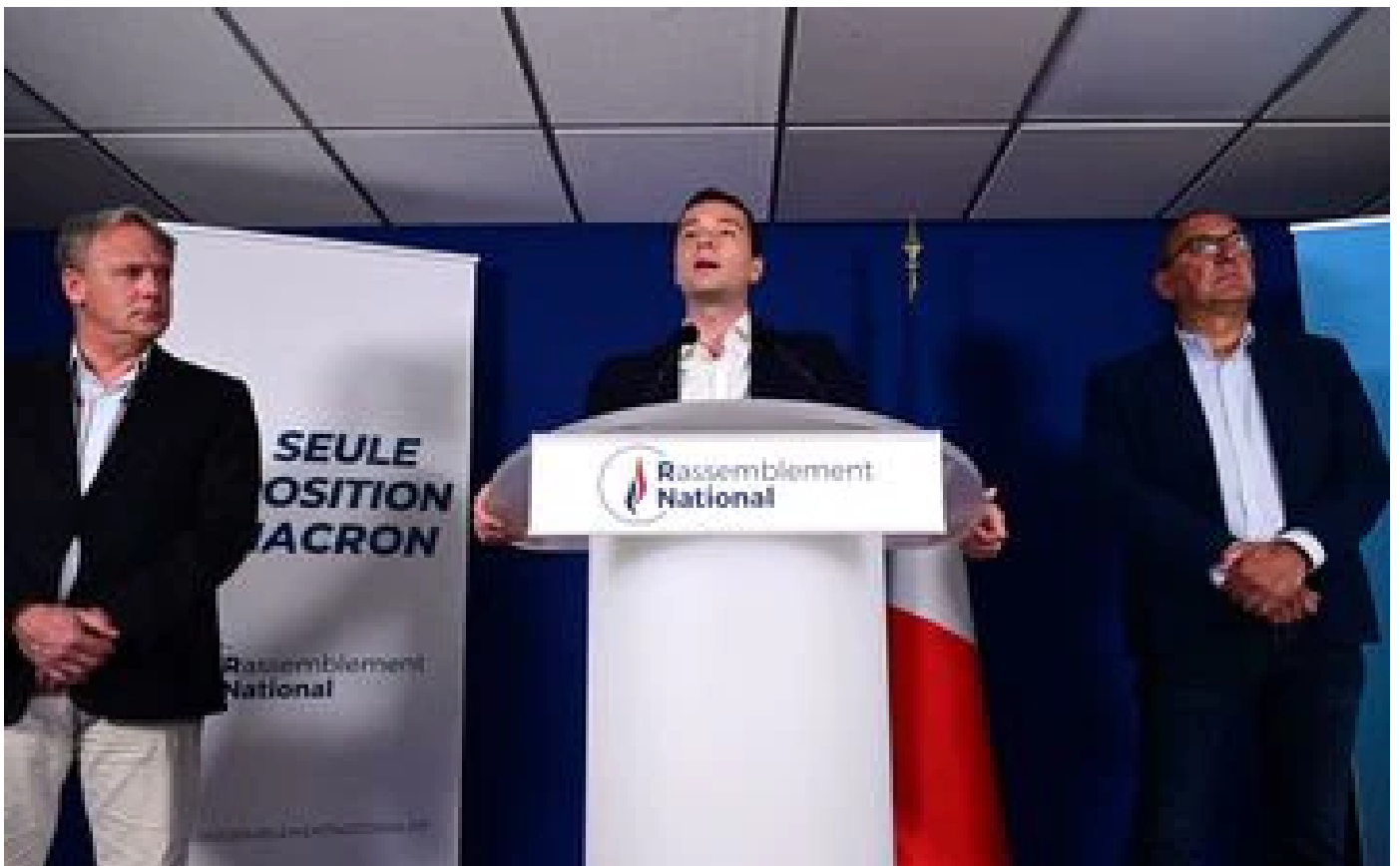
Législatives : le RN ne veut pas laisser à Mélenprout le titre de premier opposant