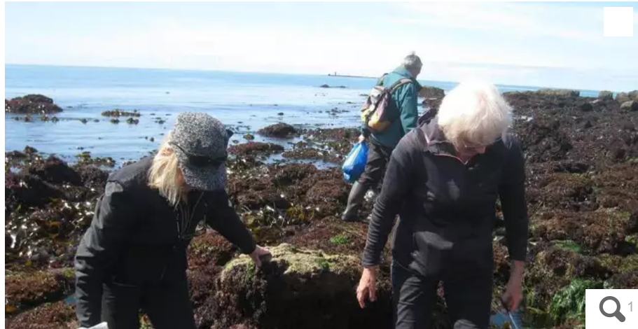
Apprendre à découvrir les algues directement sur le terrain et à les consommer, telle est la proposition de Terre d'éveil, à l'anse du Stole, mercredi prochain.

Mercredi 18 mai 2022, une sortie pour aller à la découverte des algues comestibles est organisée par l'association Terre d'Éveil, Plœmeur (Morbihan). Un atelier pour les cuisiner pourrait aussi suivre.