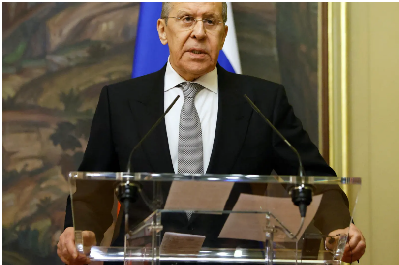
Le ministre russe des Affaires étrangères Sergei Lavrov.

Il s'en est aussi pris à «la culture dite de +l'annulation+» ("cancel culture" en anglais), assurant que les Occidentaux interdisaient les classiques: Tchaïkovski et Dostoïevski, Tolstoï, Pouchkine.