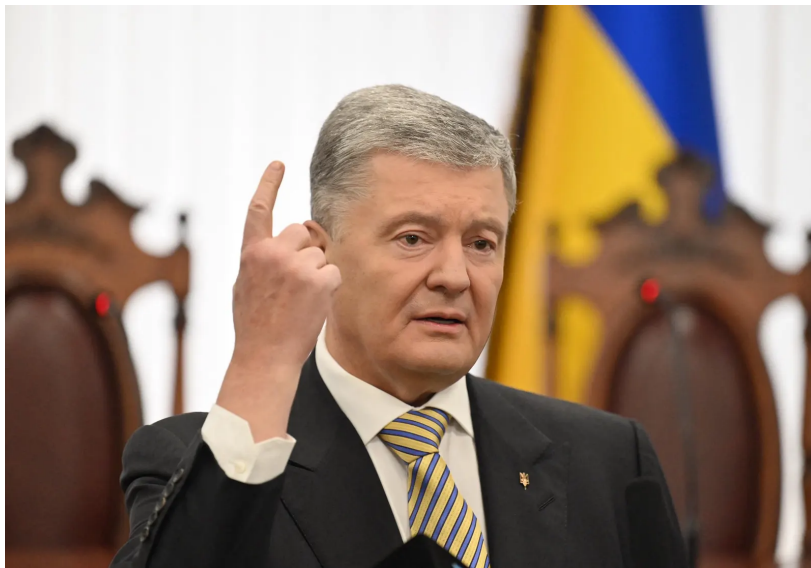
Petro Porochenko

Selon son service de presse, Petro Porochenko «s'est vu refuser de franchir la frontière de l'Ukraine» alors qu'il devait prendre part à l'assemblée parlementaire de l'Otan à Vilnius et avait reçu «toutes les permissions formelles pour quitter le pays» en tant que membre permanent de la délégation ukrainienne.