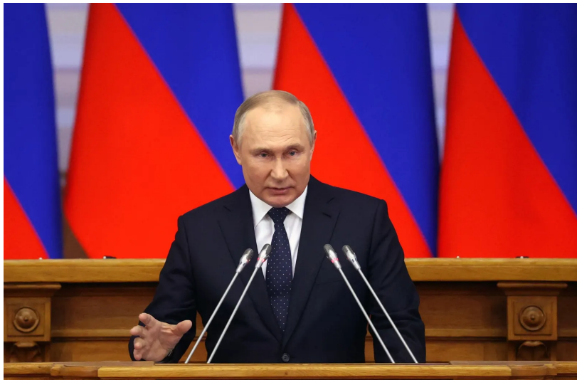
Vladimir Poutine

«La Russie est prête à aider à trouver des options pour une exportation sans entraves des céréales, y compris des céréales ukrainiennes en provenance des ports situés sur la mer Noire», a indiqué le Kremlin dans un communiqué publié à l'issue de cette conversation téléphonique, qui a eu lieu sur fond des craintes d'une grave crise alimentaire en raison de l'offensive russe en Ukraine.