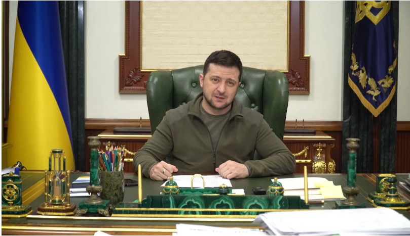
Le président ukrainien Volodymyr Zelensky.

Vingt-Sept. Des discussions sont toujours en cours pour tenter de trouver une solution avant le sommet, Paris et Berlin tout comme le président du Conseil européen se disant confiants ces derniers jours qu'un accord puisse être trouvé d'ici lundi.