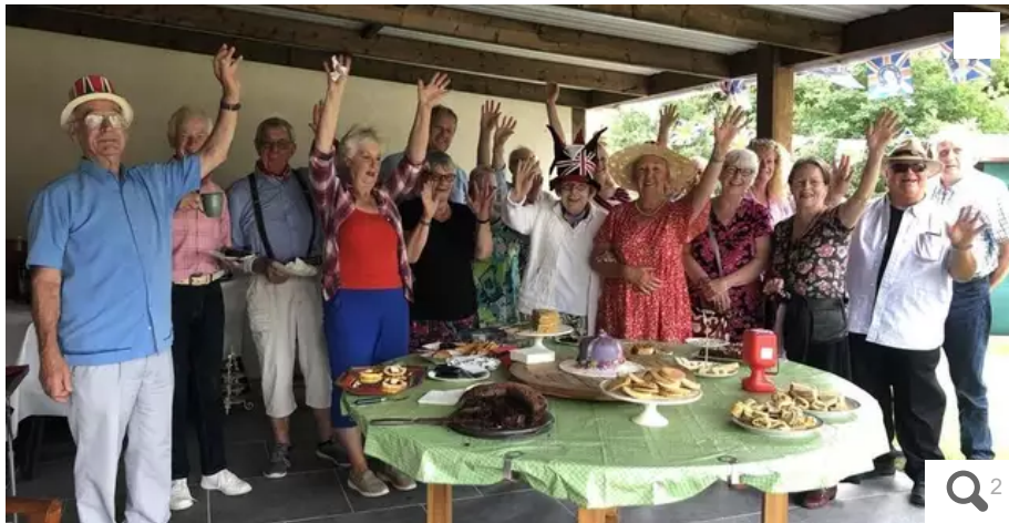
Les invités de la garden-party, membres de la Royal British Legion et des amis, ont notamment participé à une tombola pour récolter des fonds pour l'association qui vient en aide aux soldats ou vétérans et à leurs familles.

À Saint-Barthélemy (Morbihan), en Centre-Bretagne, des membres de la Royal British Legion ont organisé une garden-party pour célébrer le jubilé d'Elizabeth II, ce jeudi 2 juin 2022. Au menu : gâteau en forme de couronne, scones, transats, tombola et guirlandes de fanions.